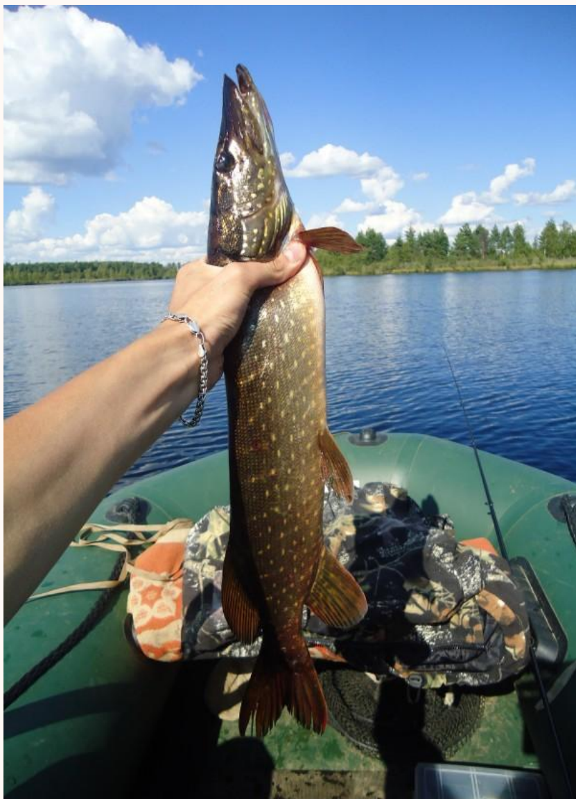
Рыболовные дневники — FION.RU