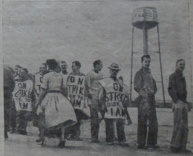
Злучаныя Штаты Амерыкі. Нядаўна аб'явілі забастоўку рабочыя завода кампаніі «Сесна эйркрафт» у Уічыто (штат Канзас). На здымку: пікет бастуючых каля прадпрыемства.