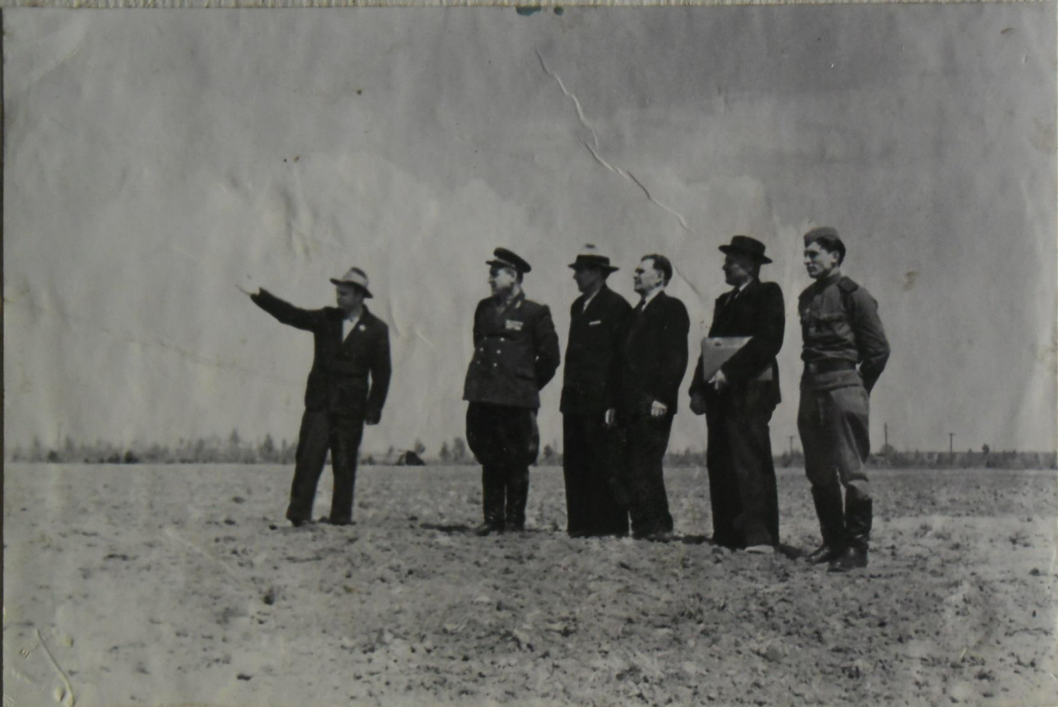
ГЕНЕРАЛ МАКСИМЦЕВ НА МЕСТЕ БОЯ Н. СИРОТИНИНА.