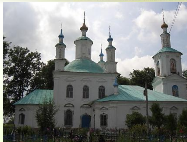
Храм Преображения Господне