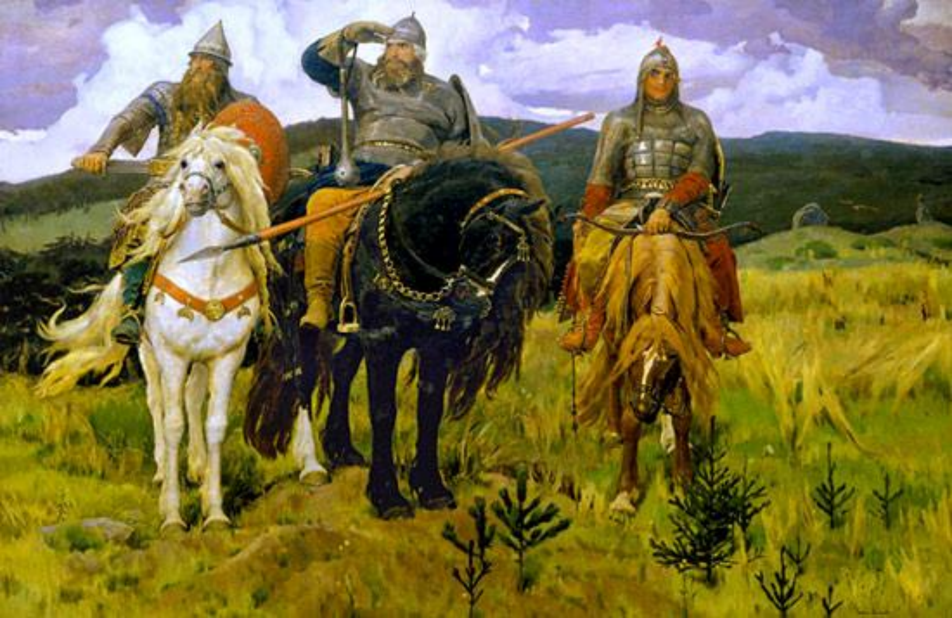
В.М. Васнецов Богатыри