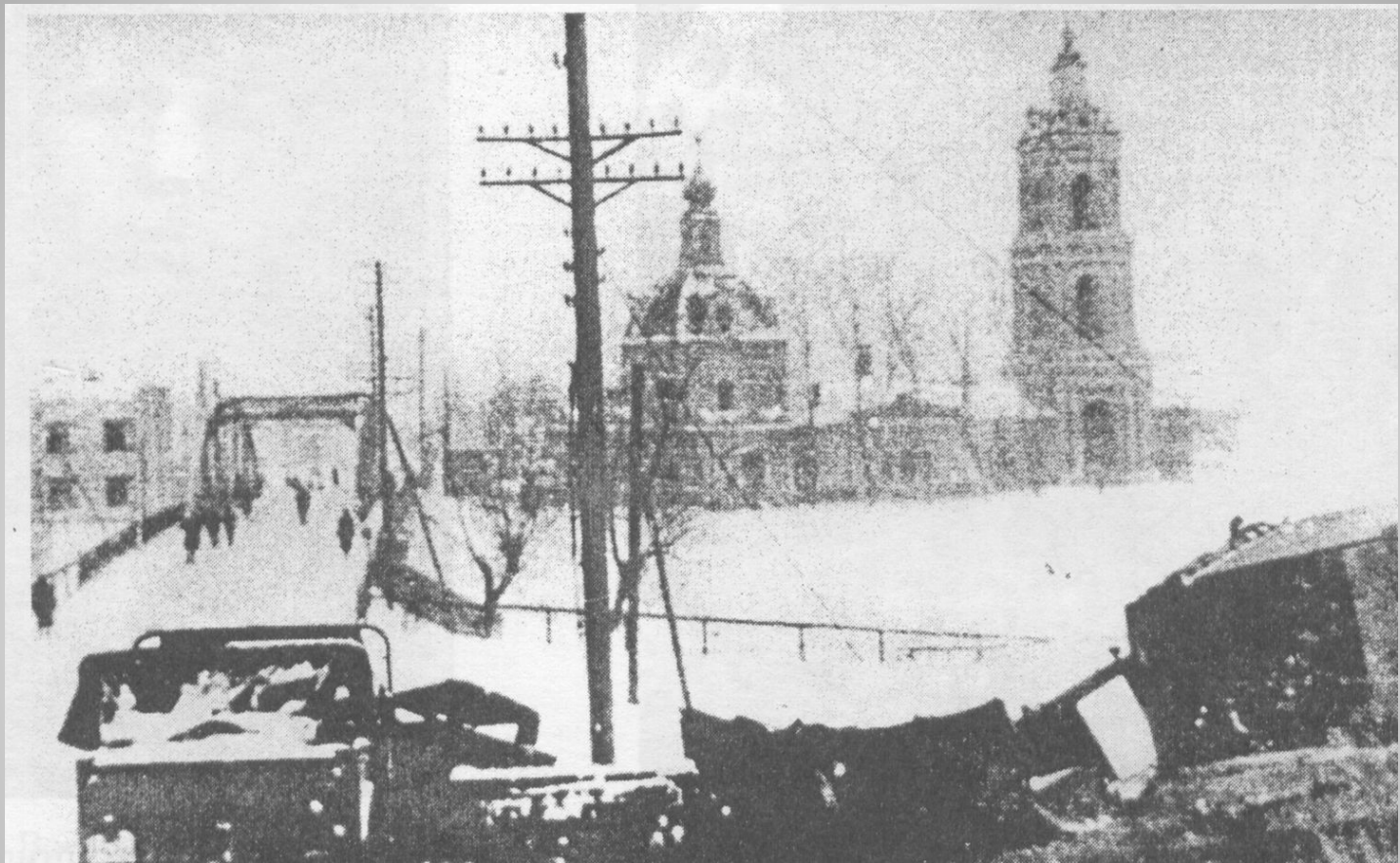
Город Михайлов 1941 год