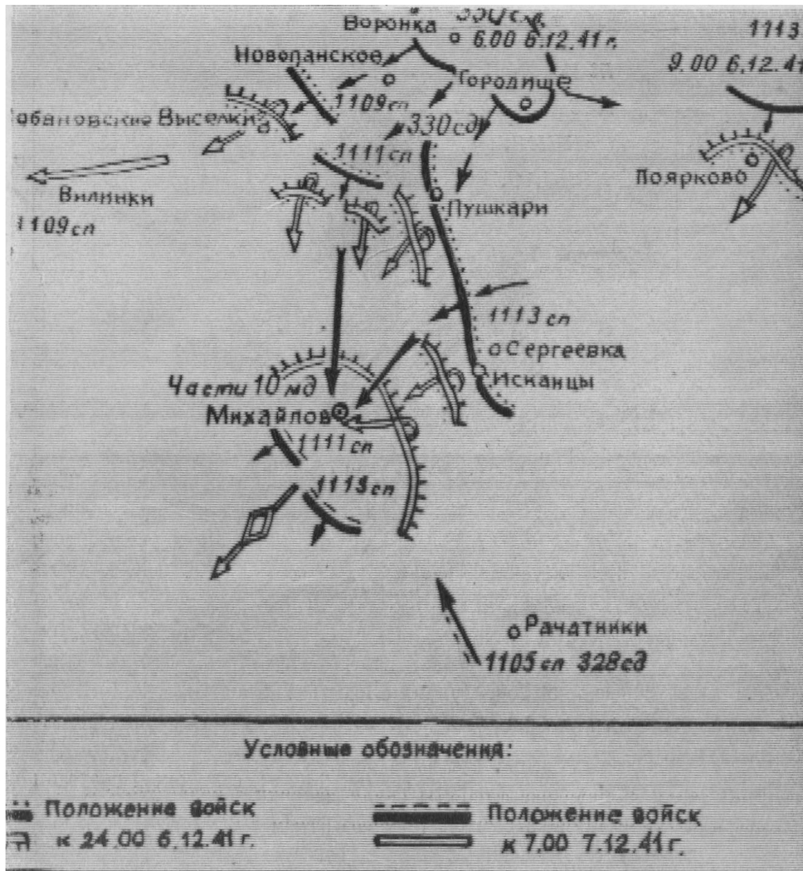
Схема. Боевые действия 330-й стрелковой дивизии г. Михайлов 6—7 декабря 1941 года.