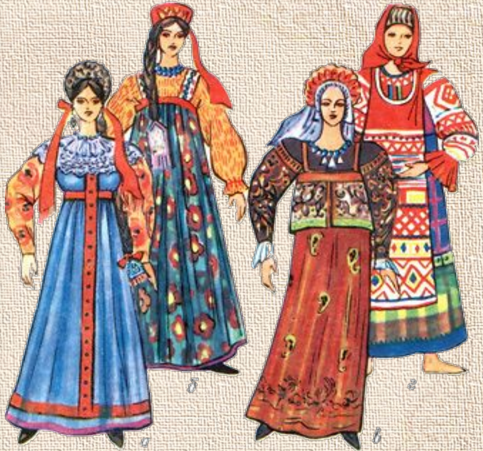
Праздничная одежда русских крестьянок