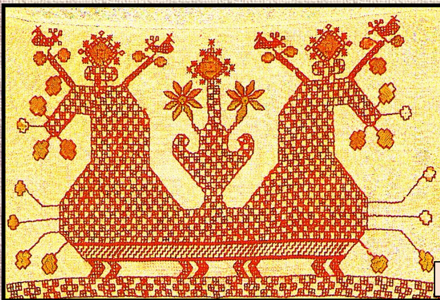
Солнечная Дева на Колеснице.