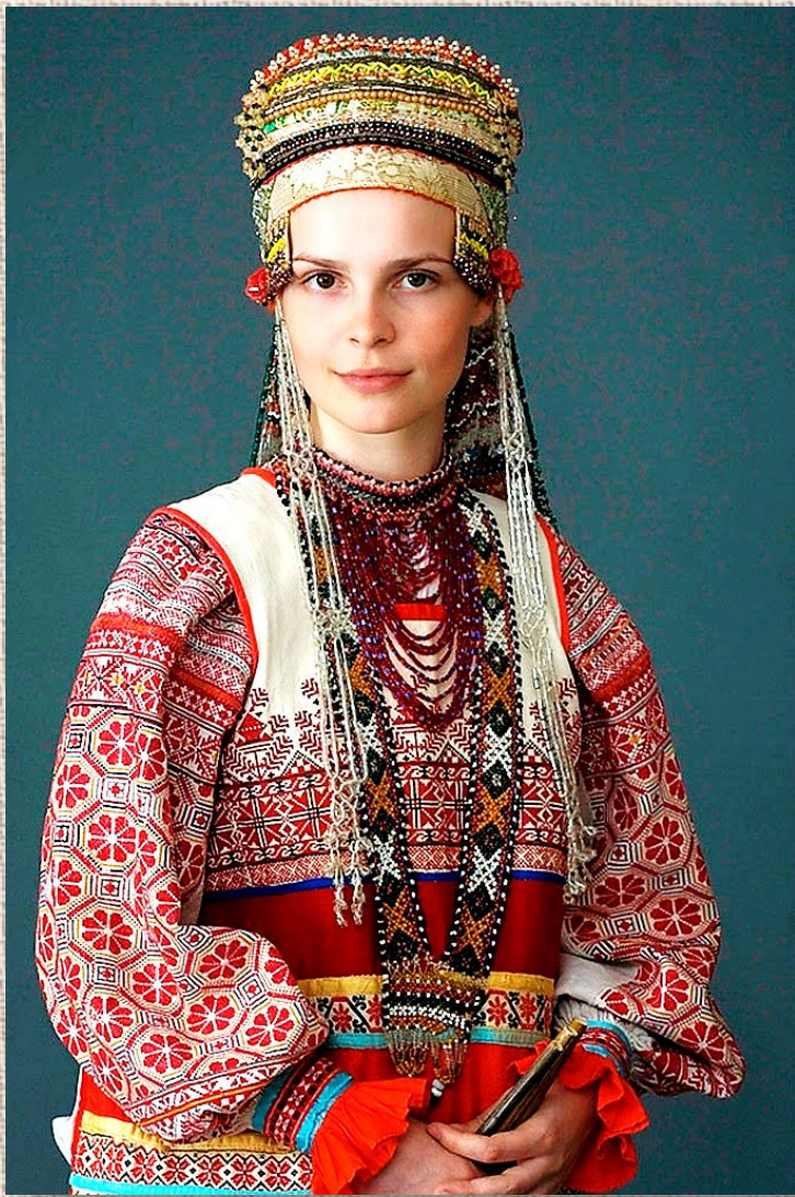
Свадебный костюм русской женщины