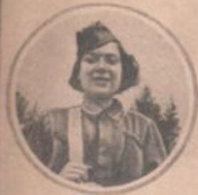
Младшая сестра Школки немедленно посылает письма раненым солдатам и офицерам. Это был один добровольцев откликнулся в труднейшие моменты и труд войны.