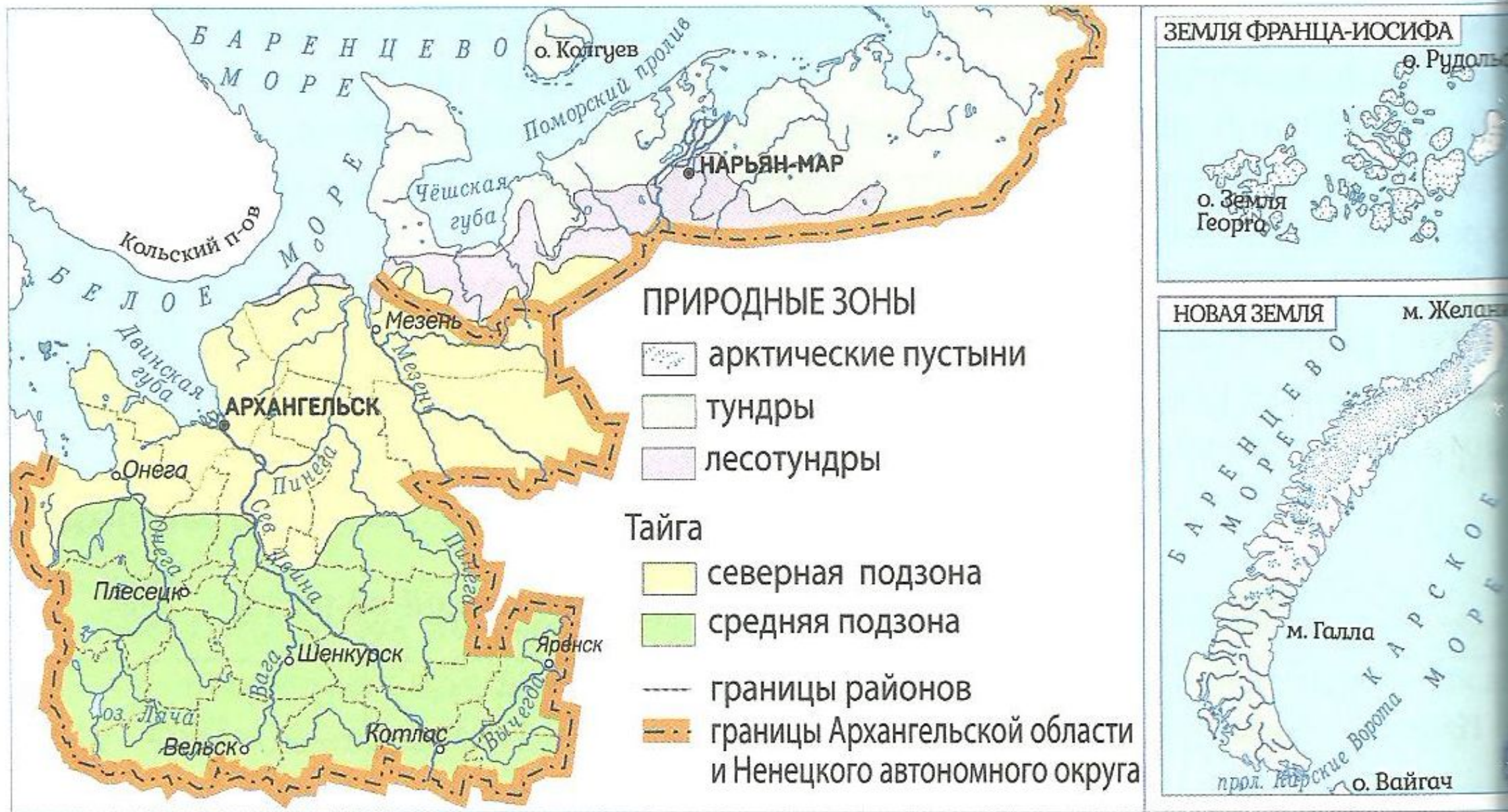
Рис. 104. Природные зоны Архангельской области