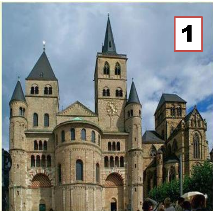
Собор в г. Трир