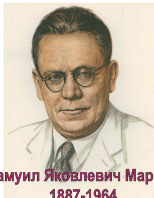
Самуил Яковлевич Маршак 1887-1964