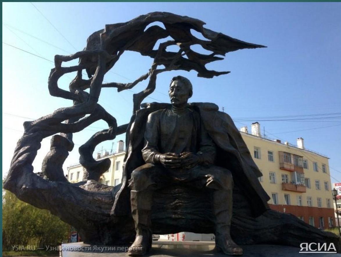
Памятник А.Е.Кулаковскому на площади Дружбы народов в г. Якутске