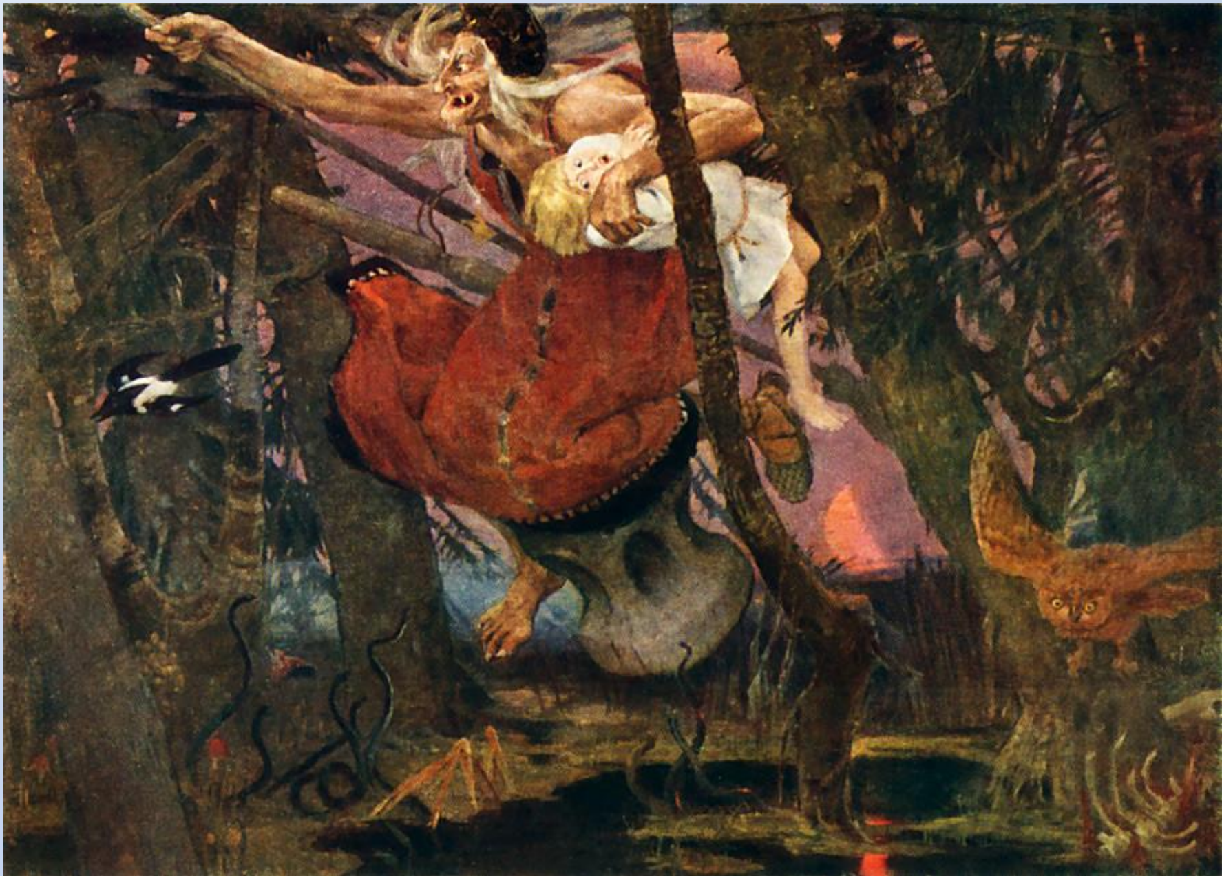
Виктор Васнецов. Баба-яга. 1917 Государственная Третьяковская галерея, Москва