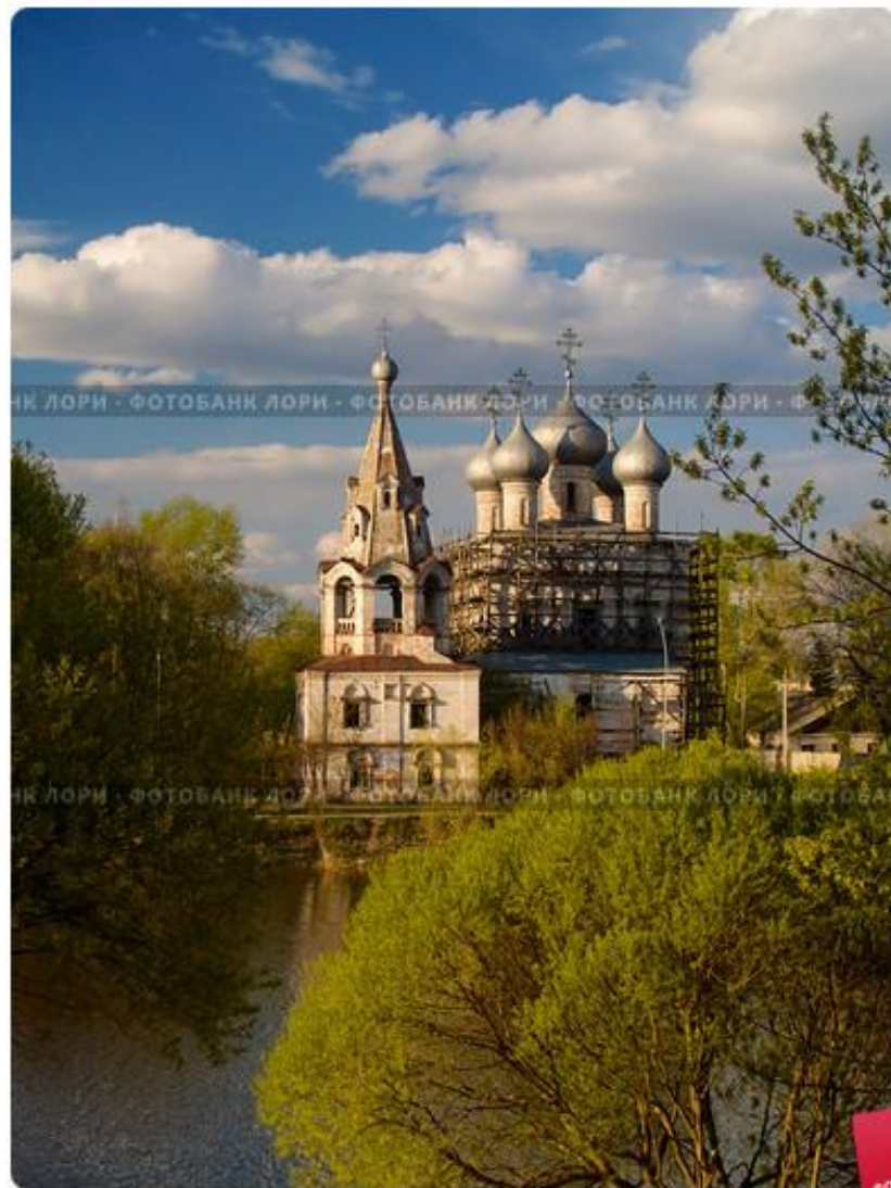
Церковь Иоанна Златоуста. Вологда