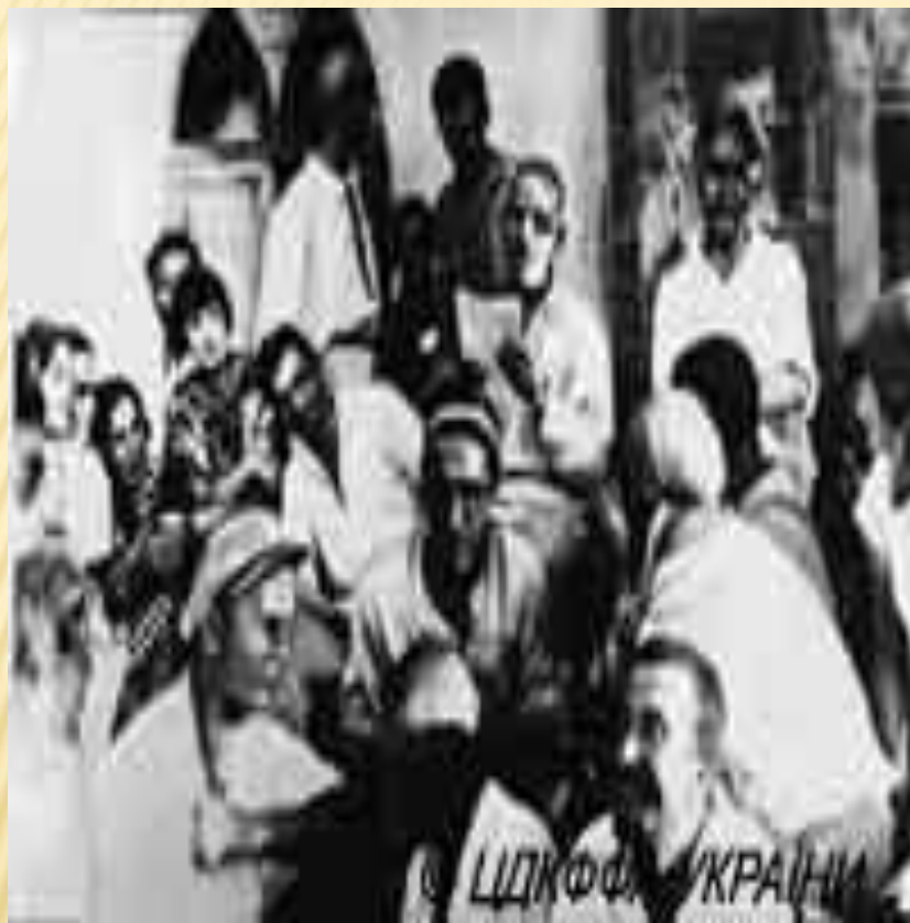
М.КУЛІШ ЧИТАЄ СВОЮ П'ЄСУ АРТИСТАМ КУРБАС ТЕАТРУ БЕРЕЗІЛЬ .1927 Р.