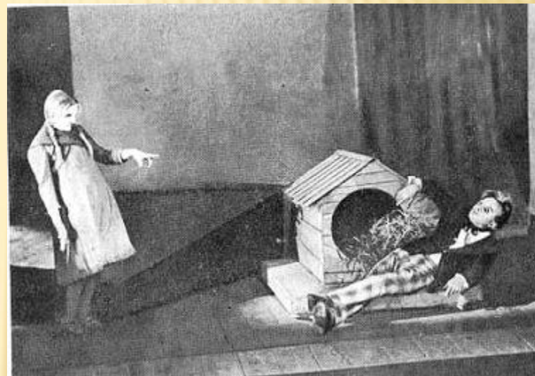
Сцена з вистави "Маклена Граса" М.Куліша. "Березіль", 1933 р.