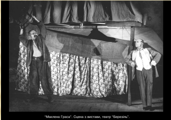
"Маклена Граса". Сцена з вистави, театр "Березіль".