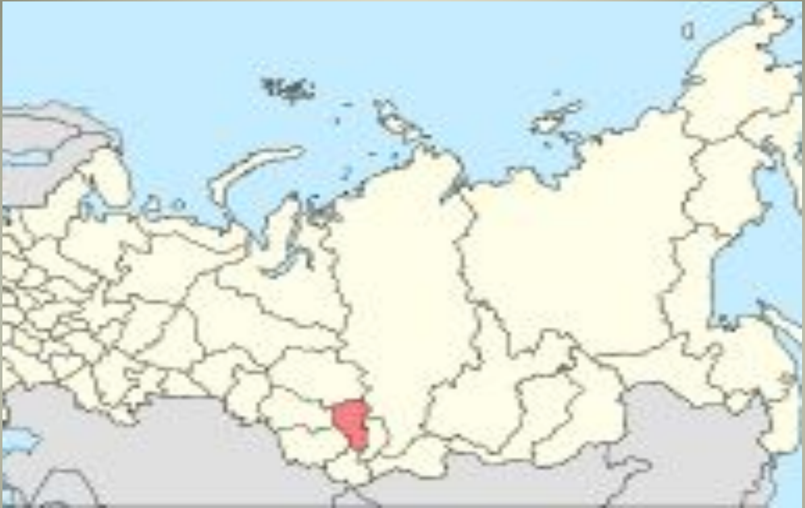
Location of Kemerovo region in Russia