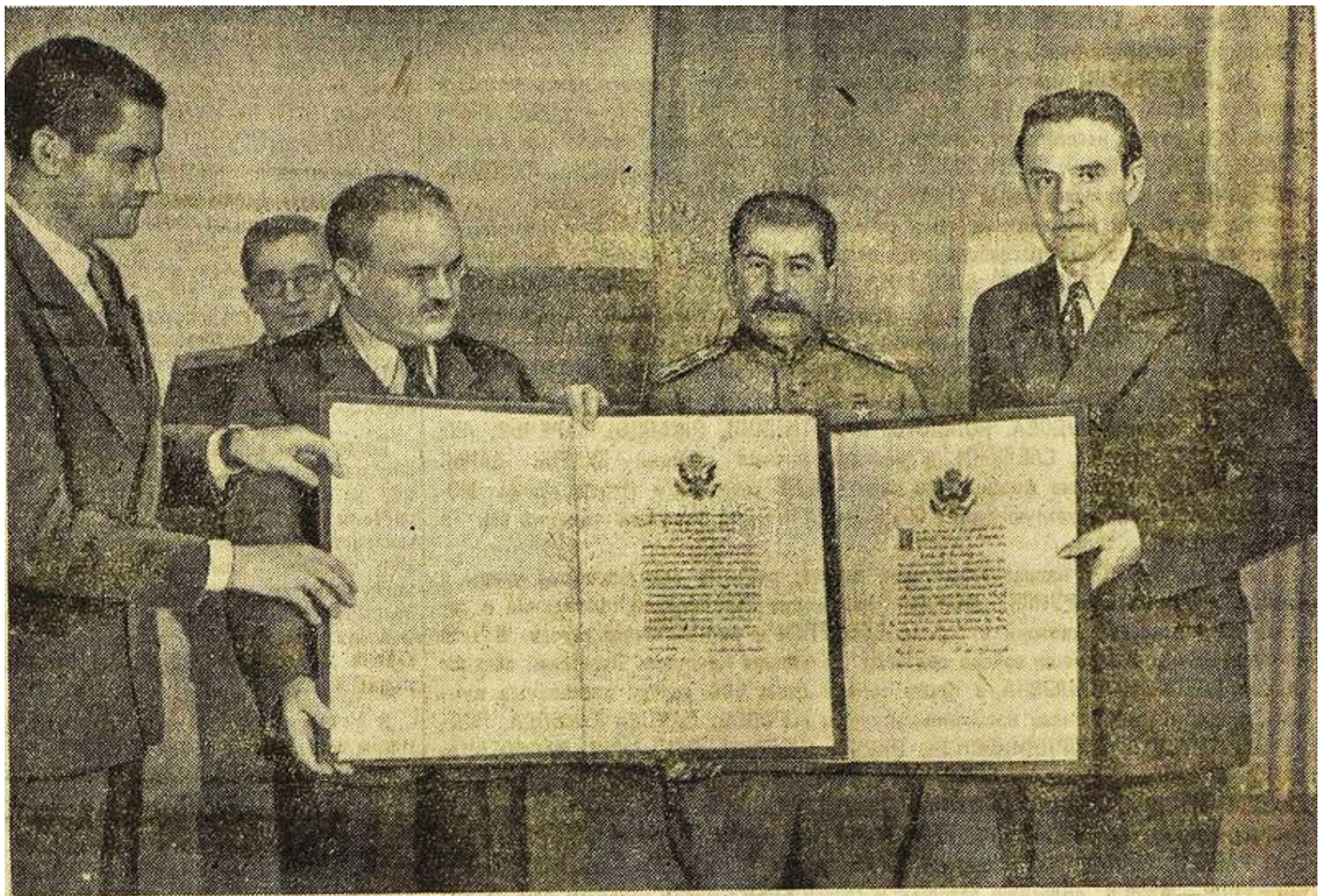
Вручение Послом США г-ном В. А. Гарриманом тов. И. В. Сталину почетных грамот Президента Рузвельта для Ленинграда и Сталинграда. На снимке (слева направо): г-н Э. Пейдж, тов. В. Н. Павлов, тов. В. М. Молотов, тов. И. В. Сталин, г-н В. А. Гарриман.