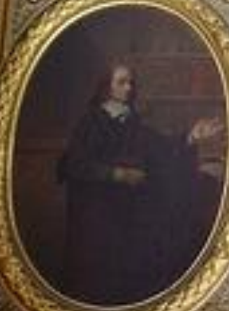
PASCAL 1623 - 1662