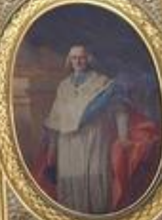
BOSSUET 1627 - 1704