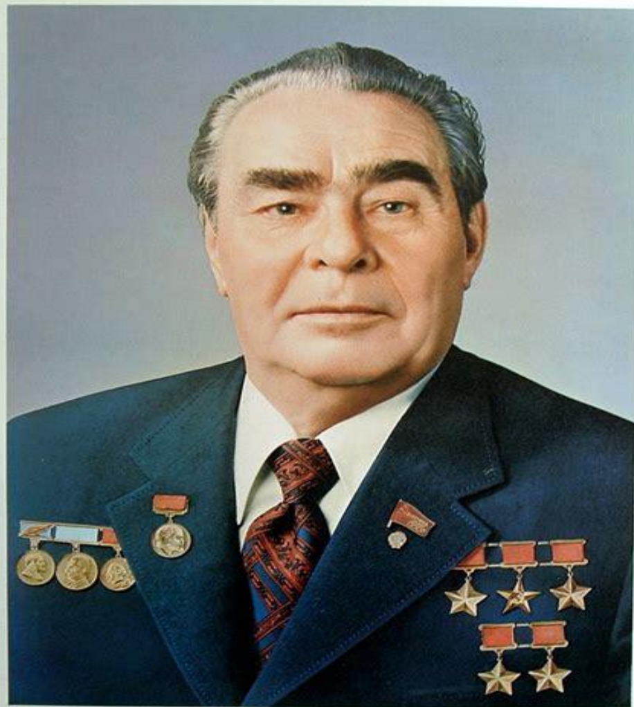
Генеральный секретарь Центрального Комитета Коммунистической партии Советского Союза, Председатель Президиума Верховного Совета СССР Леонид Ильич БРЕЖНЕВ

Октябрь 1952 года – Брежнев одновременно получает от Сталина должность секретаря ЦК КПСС, становится членом ЦК и кандидатом в члены Президиума ЦК. - 7 ноября 1952 года – Брежнев впервые на трибуне Мавзолея. - 1953 год – после смерти И.В. Сталина стремительная карьера Леонида Ильича на время прервалась. Он был понижен в должности и стал 1-м заместителем начальника Главного политического управления Советской армии и флота