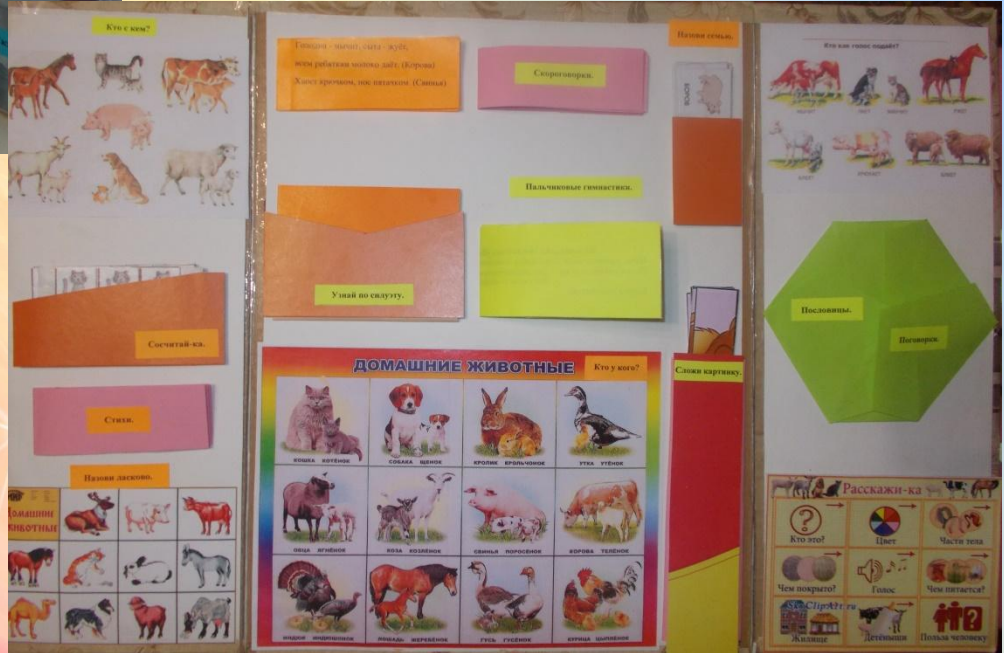
«Зима» и «Домашние животные» - тематических недель.