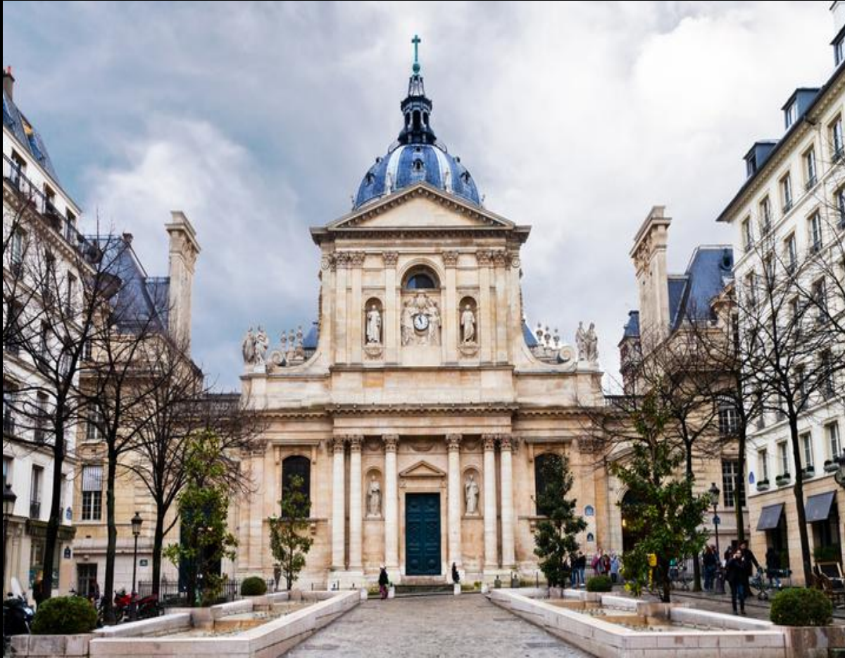
GOLUBTCOVA A, F-42