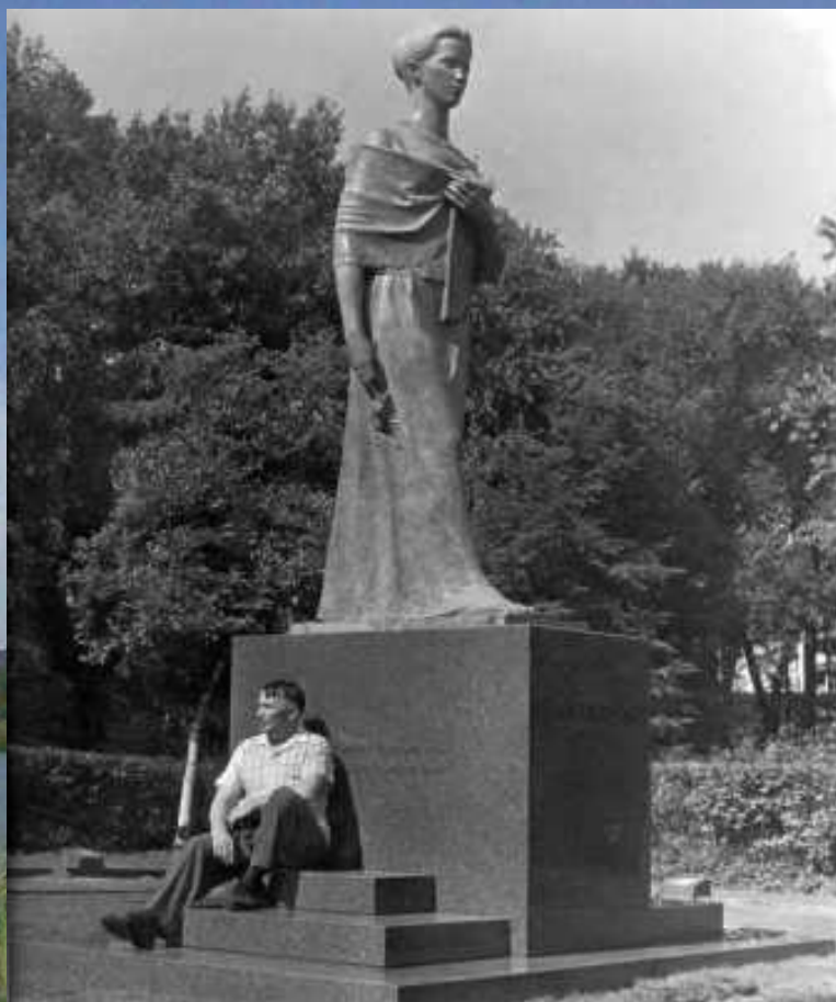
Пам'ятник Лесі Українки у Клівленді