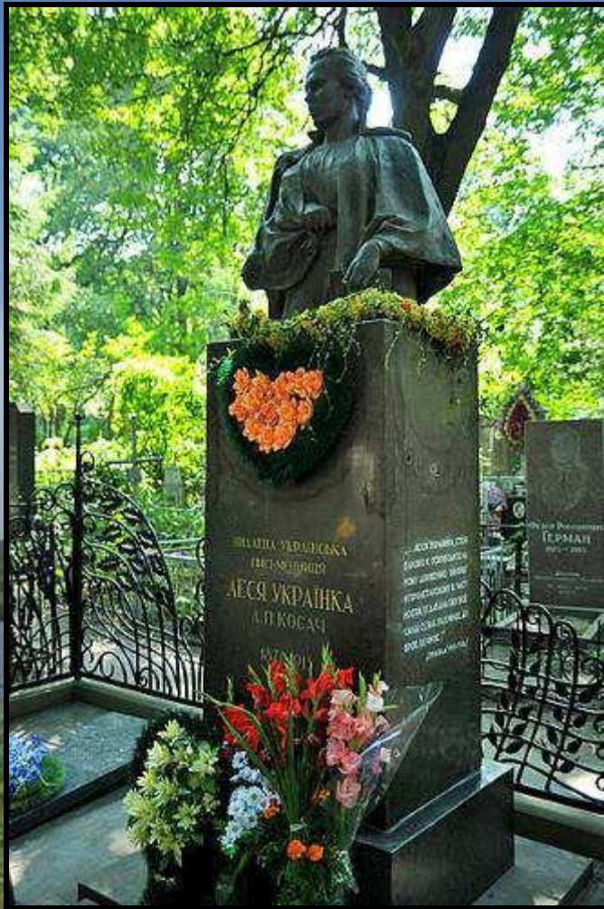
Могила Лесі Українки