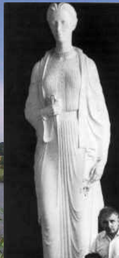
Пам'ятник Лесі Українки у Торонто