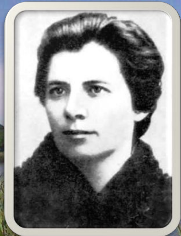
Ольга Косач – мати Лесі Українки. Псевдонім Олена Пчілка