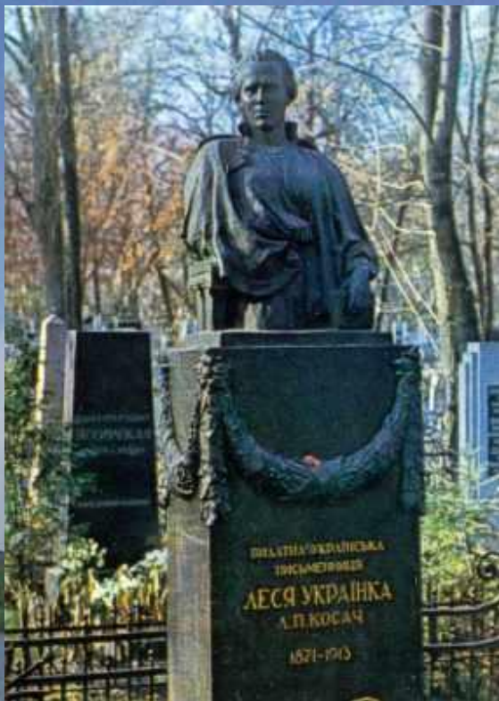
Пам'ятник на могилі Лесі Українки на Байковому кладовищі в Києві. Скульптор Г.Л. Петрашевич. Встановлено в 1939 р.