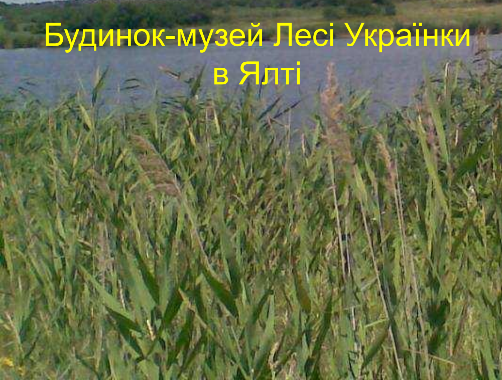
Будинок-музей Лесі Українки в Ялті