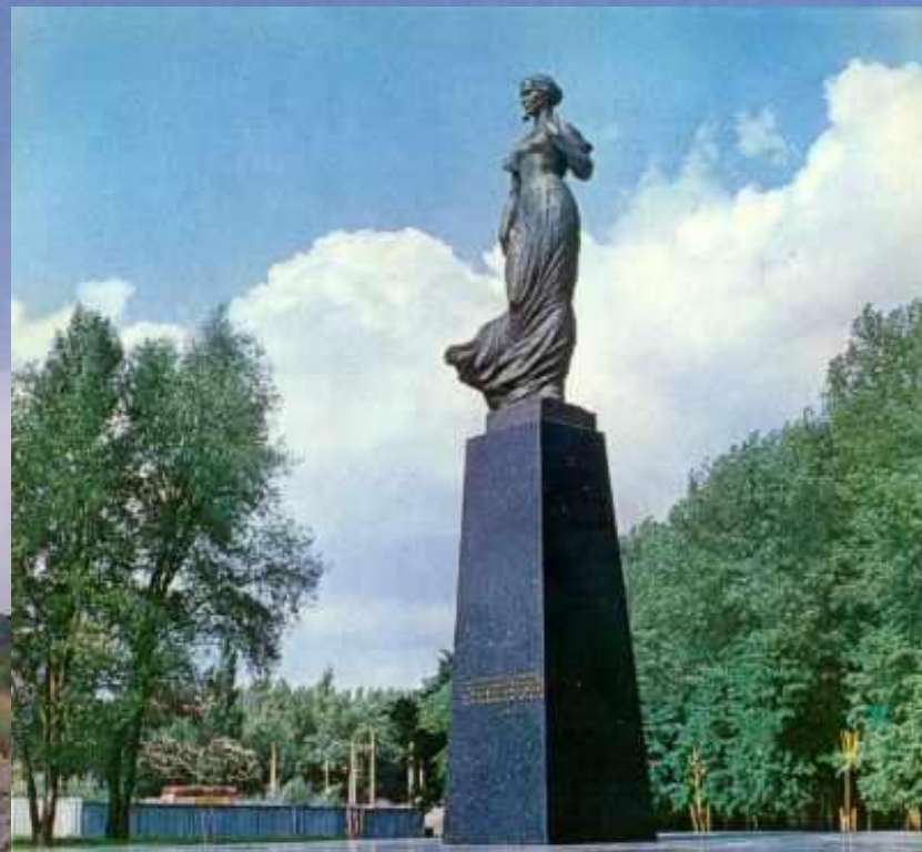
Пам'ятник Лесі Українці в Києві (площа Лесі Українки). Скульптор Г.Н.Кальченко, архітектор А.Ф.Ігнащенко. Встановлено в 1973 р.