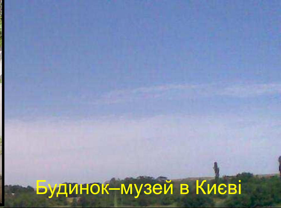
Будинок-музей в Києві