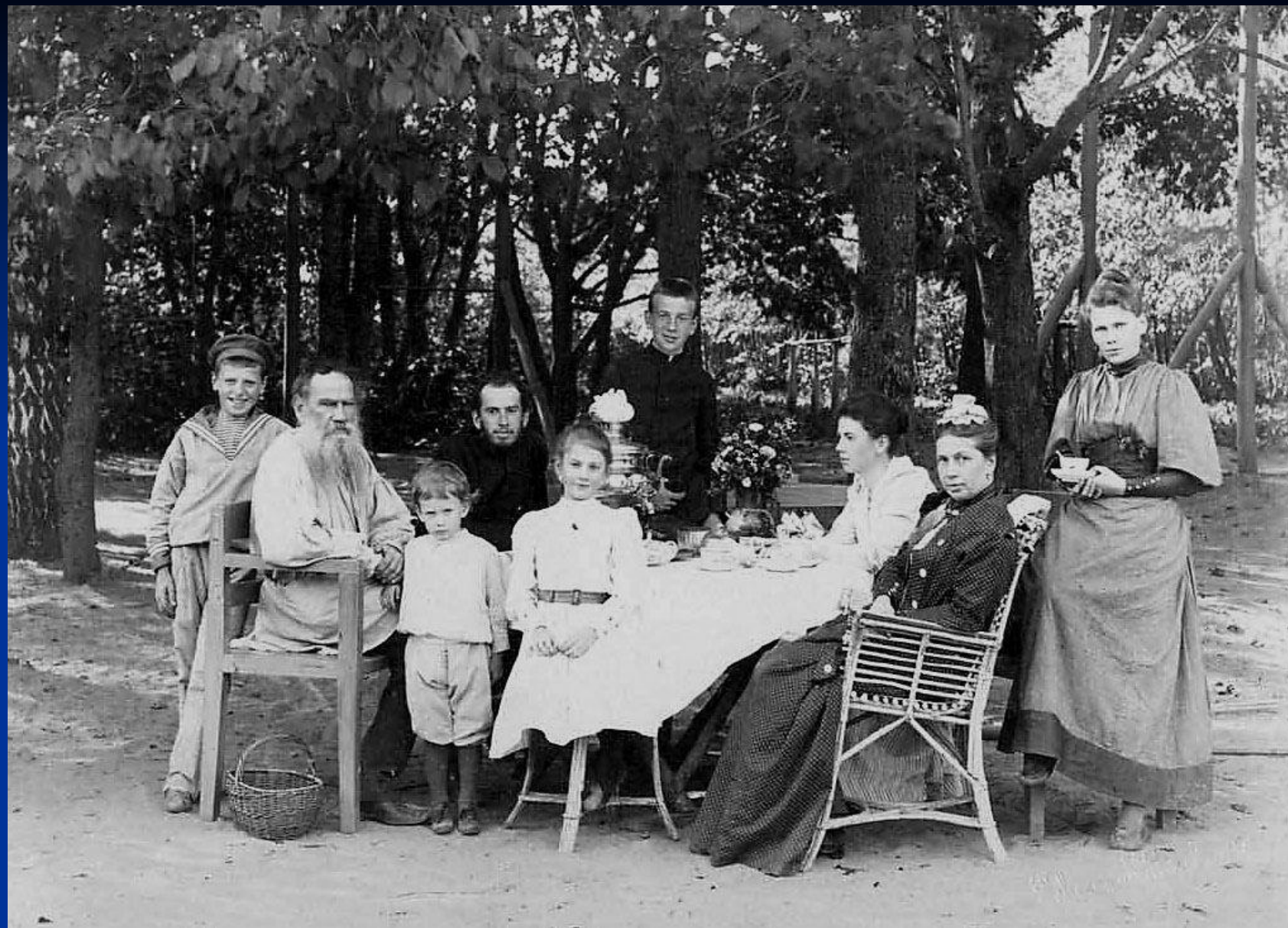
Семья Толстого: Михаил, Лев Николаевич, Ванечка, Лев, Александр, Андрей, Татьяна, Софья Андреевна, Мария. Фото 1892 года.