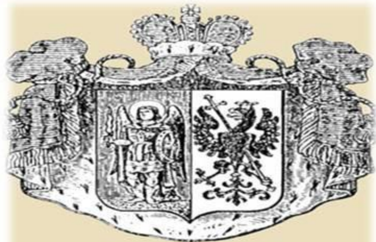
Герб князей Волконских

Лев Николаевич Толстой родился в усадьбе Ясная Поляна 9 сентября 1828 года. Отец был участником Отечественной войны 1812 года. Мать принадлежала к роду Волконских. По матери Толстой был родственником А.С. Пушкина.