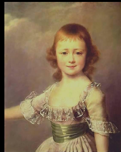
Екатерина Павловна (1788 - 1818)