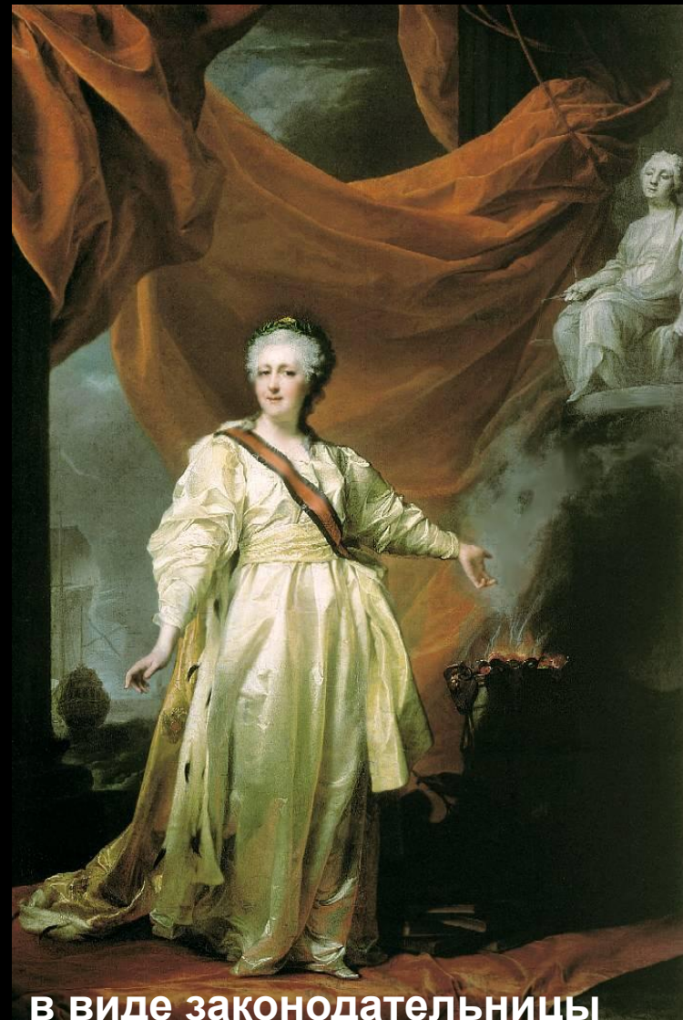
в виде законодательницы в храме богини Правосудия