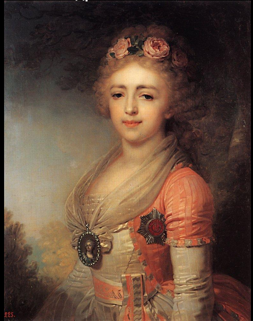
1796 г В. Л. Боровиковский