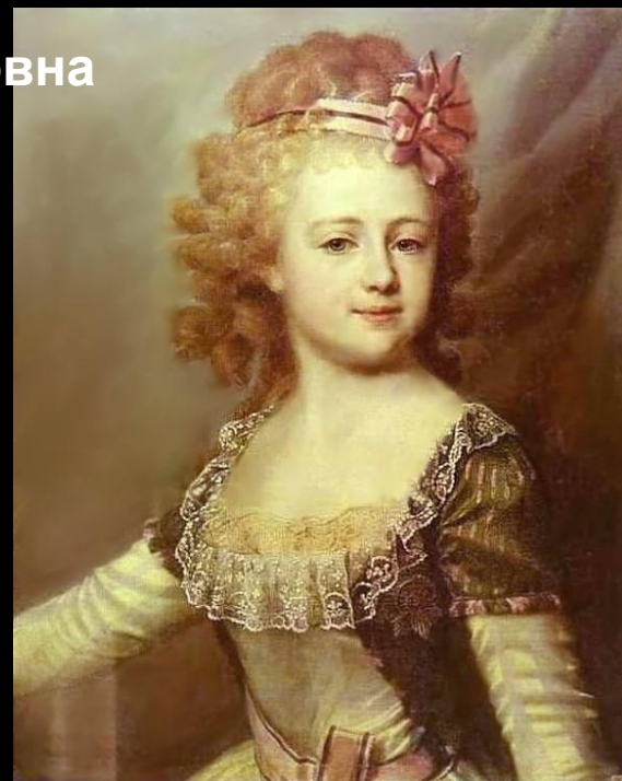
Александра Павловна (1783-1801)