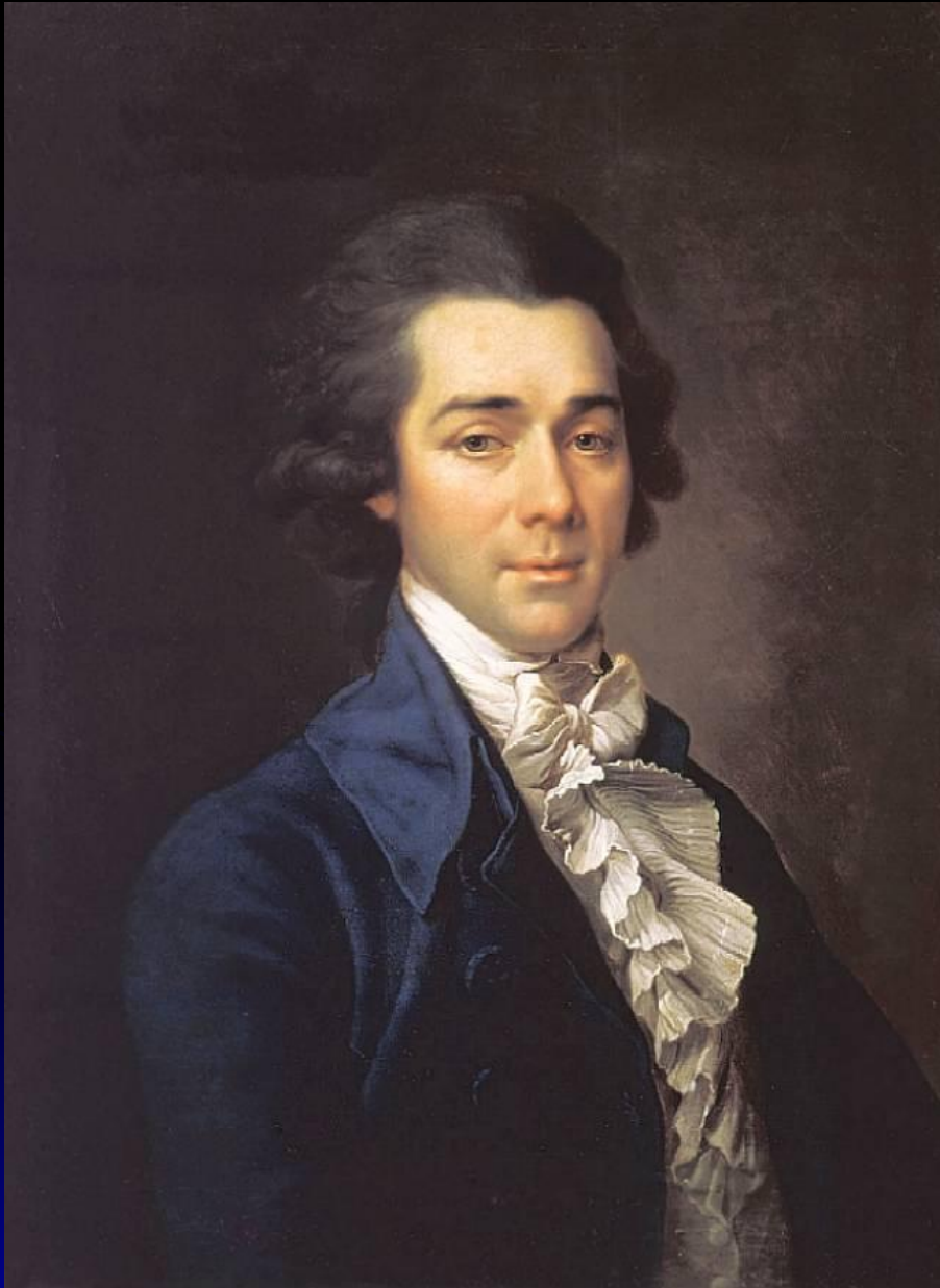
Портрет Н. А. Львова

Романтична история знакомства Н. А. Львова с М. А.Дьяковой, которое перешло в трогательную взаимную любовь