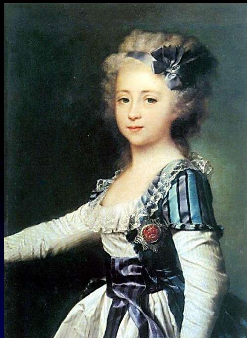
Елена Павловна (1784-1803),