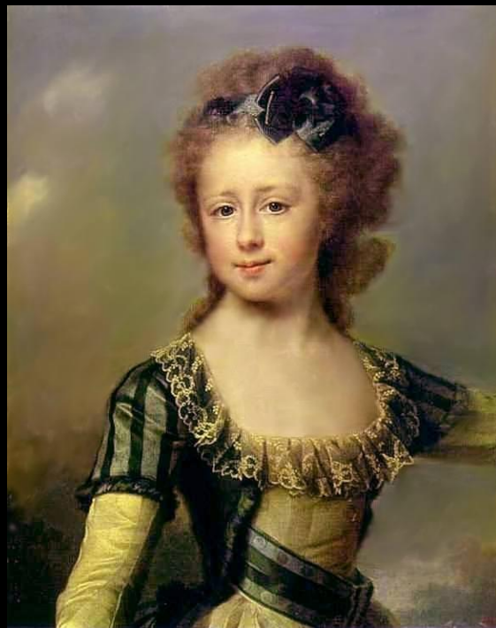
Мария Павловна (1786-1859)