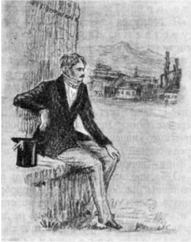
Григорий Печорин. Иллюстрация П.Павлинова