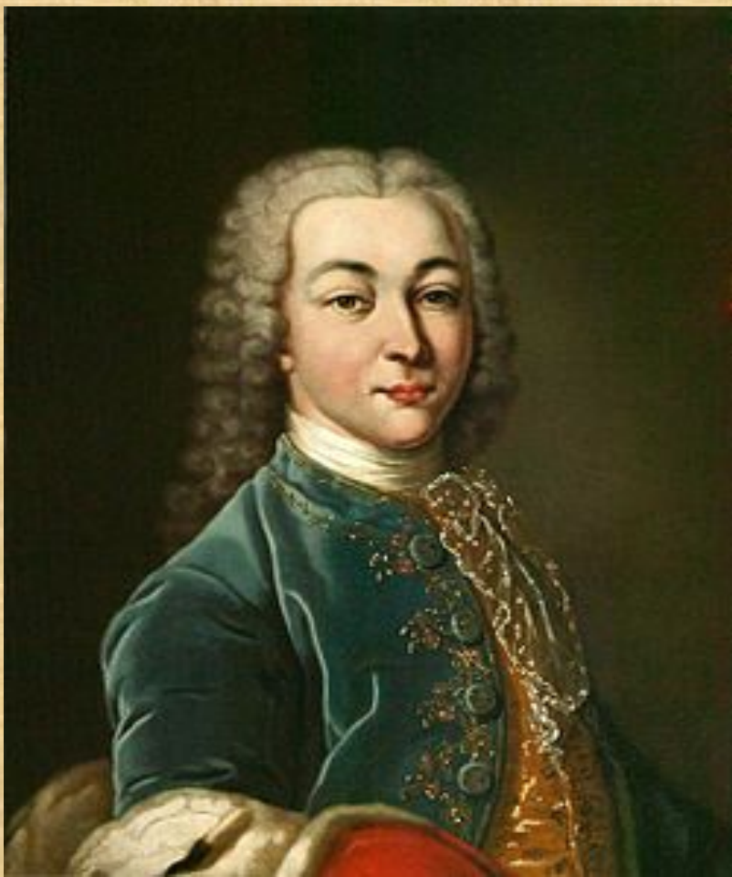
Князь А. Д. Кантемир