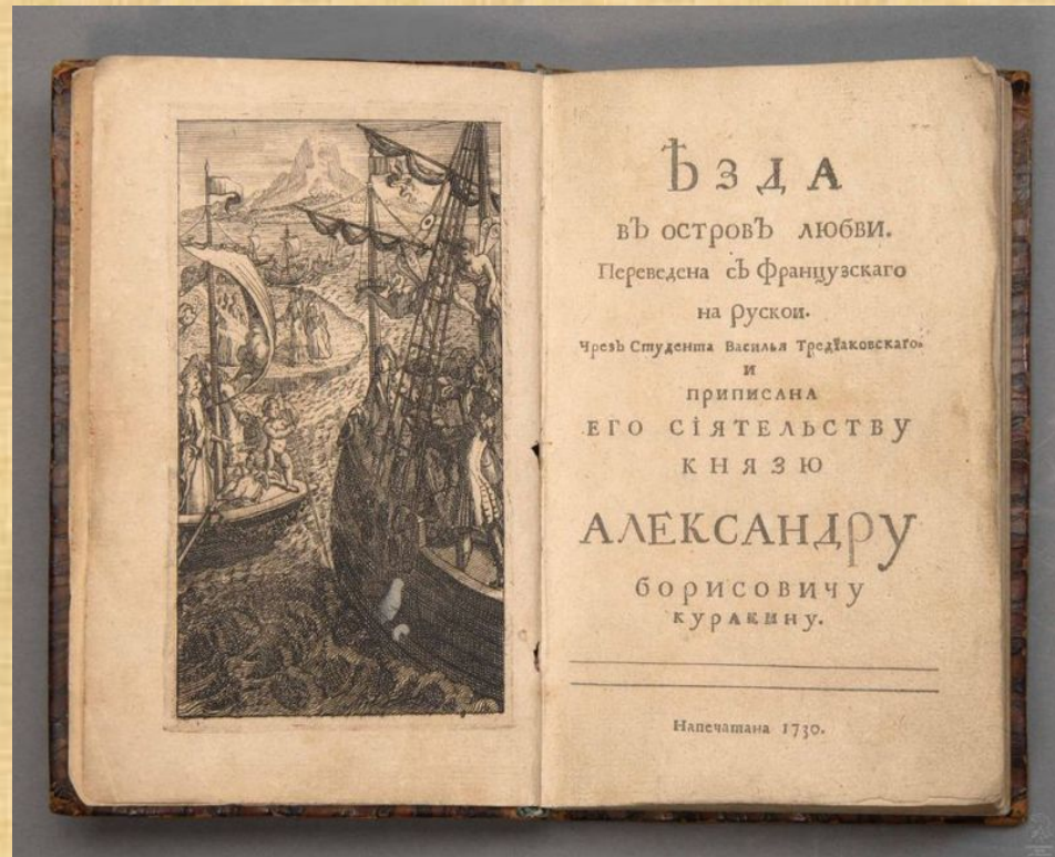
Фронтиспис и титульный лист издания 1730 года.