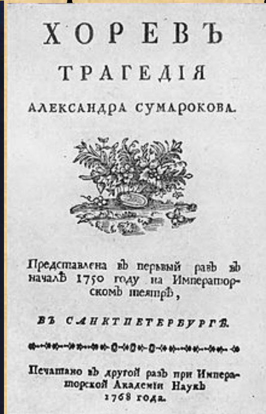
Титульный лист второго издания «Хорева», 1768