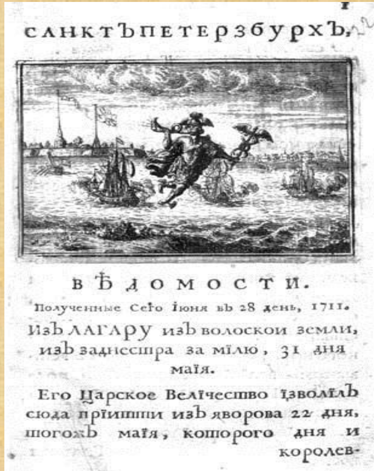
«Вѣдомости» от 28 июня 1711 года