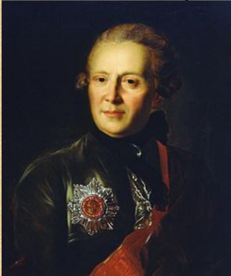
Александр Петрович Сумароков. Портрет работы Фёдора Рокотова (1777)