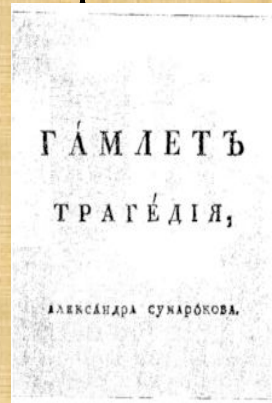
Первая страница издания 1748 года