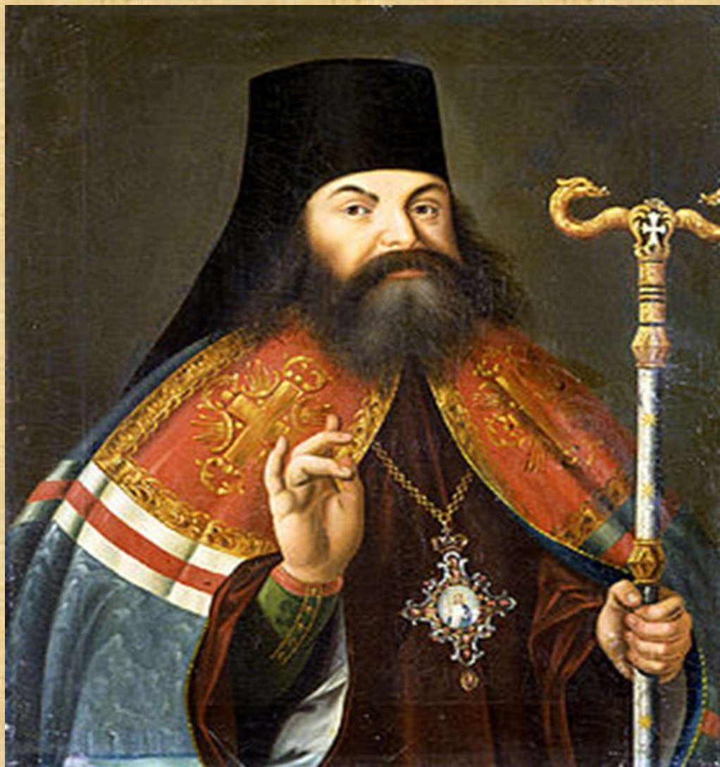
Феофан Прокопович. Парсуна. Середина XVIII в.