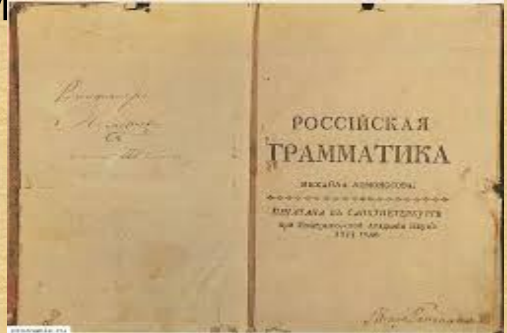
Российская грамматика М. В. Ломоносова. Титульный лист

Бумага, гравюра резцом. Э. Фессар и К. А. Вортман. 1757 г. Из изд.: Ломоносов М. В.