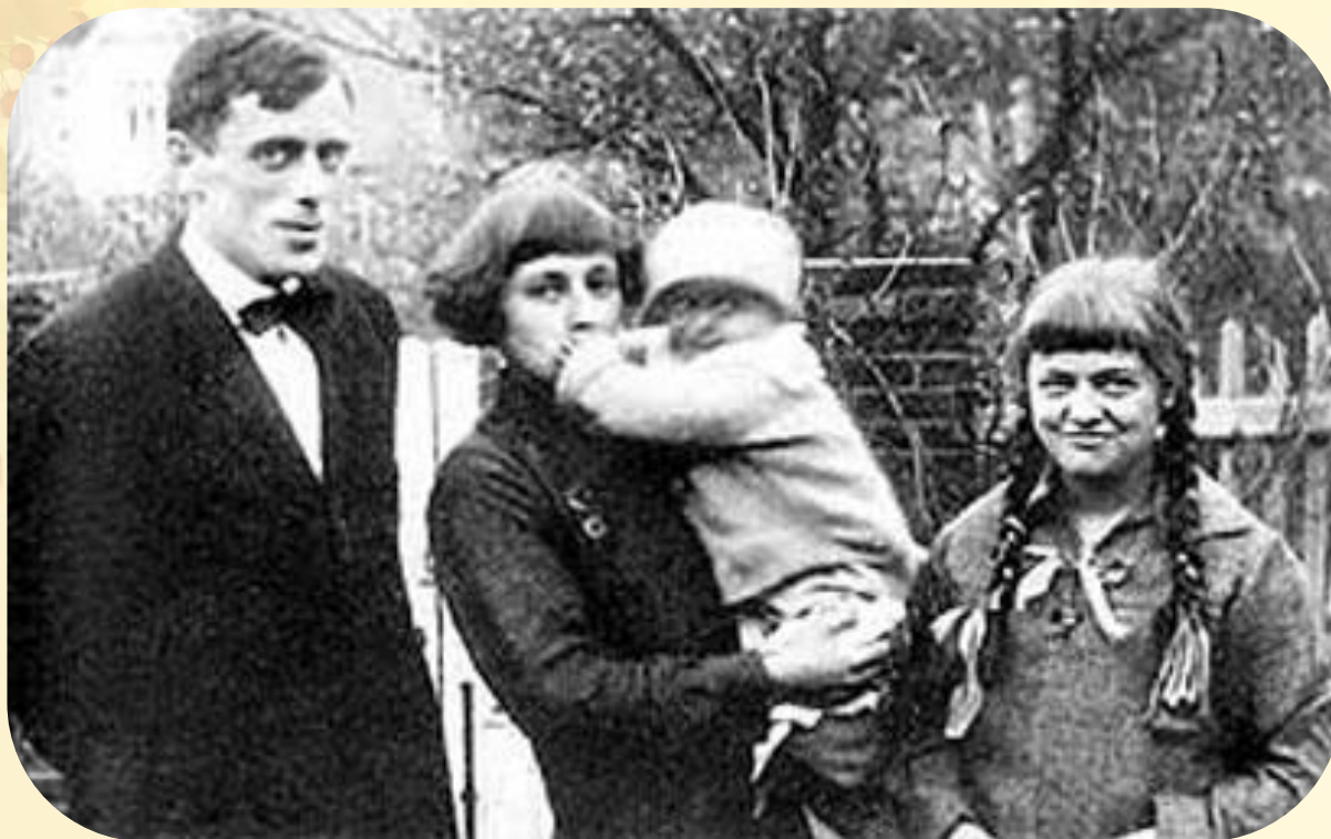
М.И. Цветаева с мужем и детьми, 1925 г.