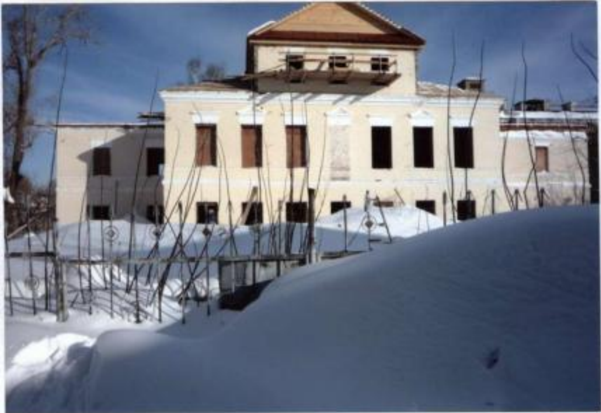
Улица. Япеева. д.15.