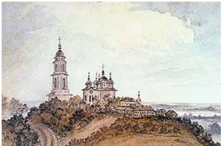
Воздвиженський монастир в Полтаві