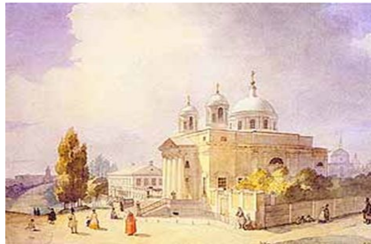
Олександрівський костьол в Києві