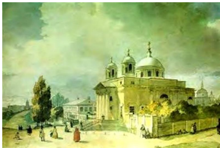
Почаївська лавра з заходу