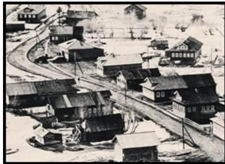
Деревня, где родился М. В. Ломоносов

Детство оставило неизгладимый след на характере Ломоносова. Именно в детстве сложились его патриотические убеждения и жажда знаний.