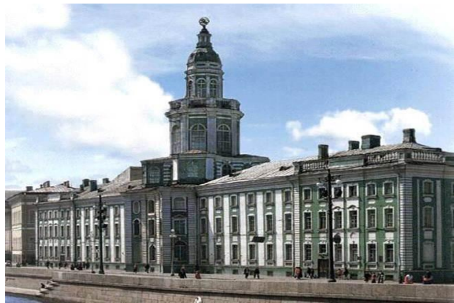
Петербургская академия Наук