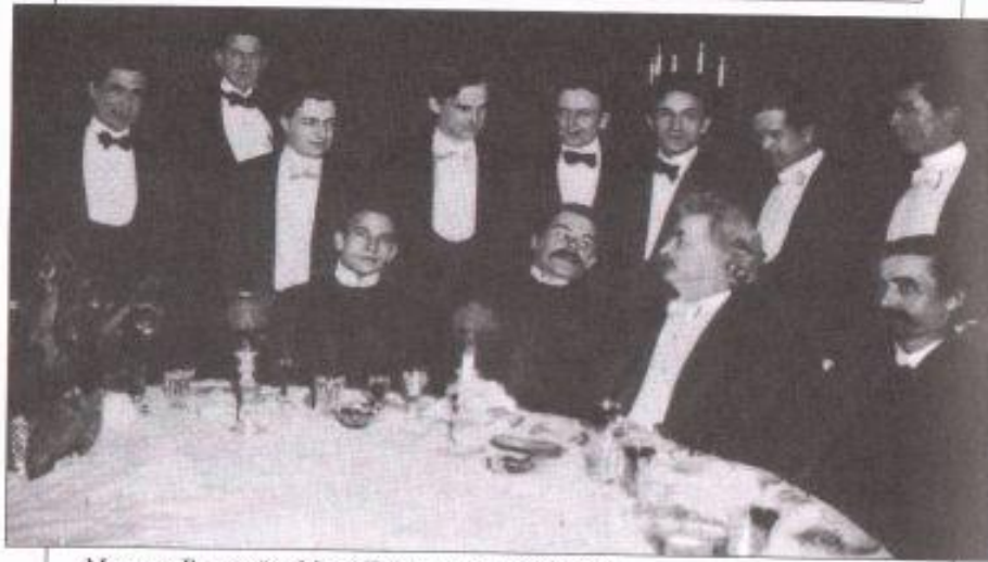
Максим Горький и Марк Твен в клубе писателей. Нью-Йорк, 1906