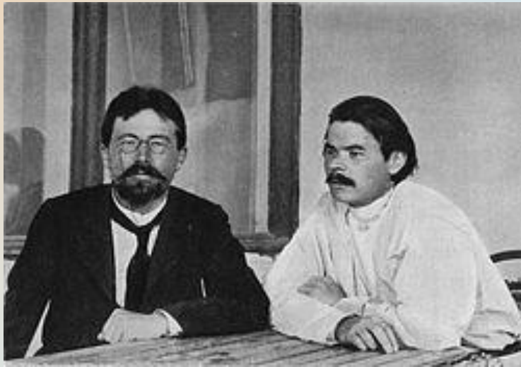
Чехов и Максим Горький

Как это ни удивительно, до сих пор никто не имеет о многом в жизни Горького точного представления.