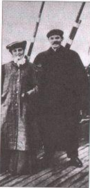
М. Горький и М. Андреева на пути в Америку. 1906

Статья «Буря энтузиазма...» о приезде Горького в США в газете «Нью-Йорк Таймс»