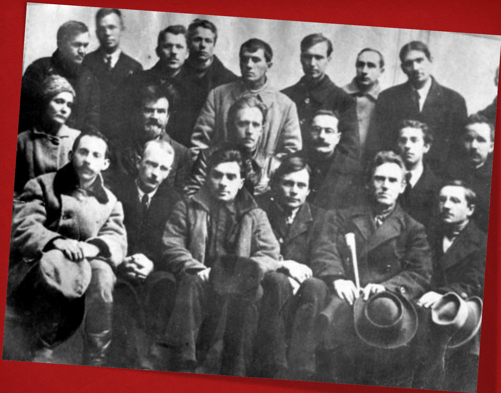
Зустріч харківських і київських митців. Київ, 1923 р.