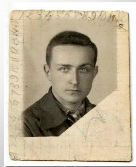
Фотография Эфрона с фронта

После смерти Цветаевой ни папу, ни Алю Мур никогда больше не увидел. Сергей Эфрон был расстрелян еще в конце июля. Ариадна будет реабилитирована только в 1955 году, вернется в Москву, но брата в живых уже не застанет – в июле 1944 года он умрет в госпитале от смертельного ранения.