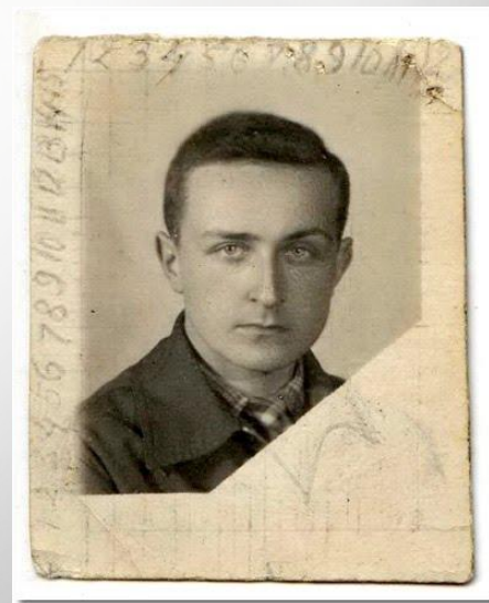
Фотография Эфрона с фронта

После смерти Цветаевой ни папу, ни Алю Мур никогда больше не увидел. Сергей Эфрон был расстрелян еще в конце июля. Ариадна будет реабилитирована только в 1955 году, вернется в Москву, но брата в живых уже не застанет – в июле 1944 года он умрет в госпитале от смертельного ранения.