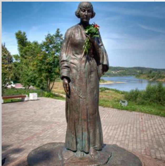
ПАМЯТНИК МАРИНЕ ЦВЕТАЕВОЙ В ГОРОДЕ ТАРУСА НА БЕРЕГУ ОКИ. ОТКРЫТ 8 ОКТЯБРЯ 2006Г.