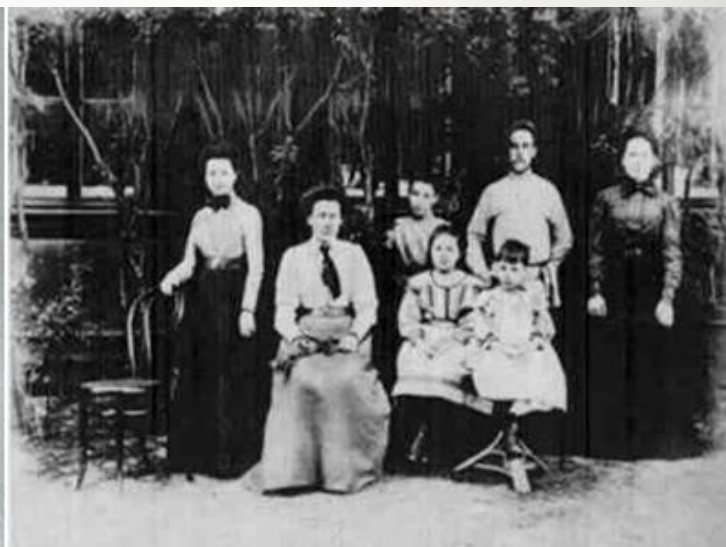
Семья Цветаевых в Тарусе