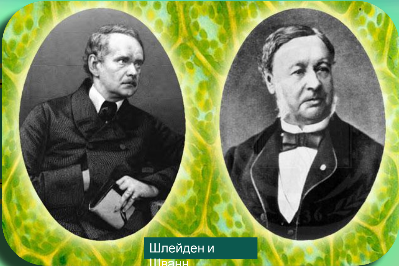
Шлейден и Шванн