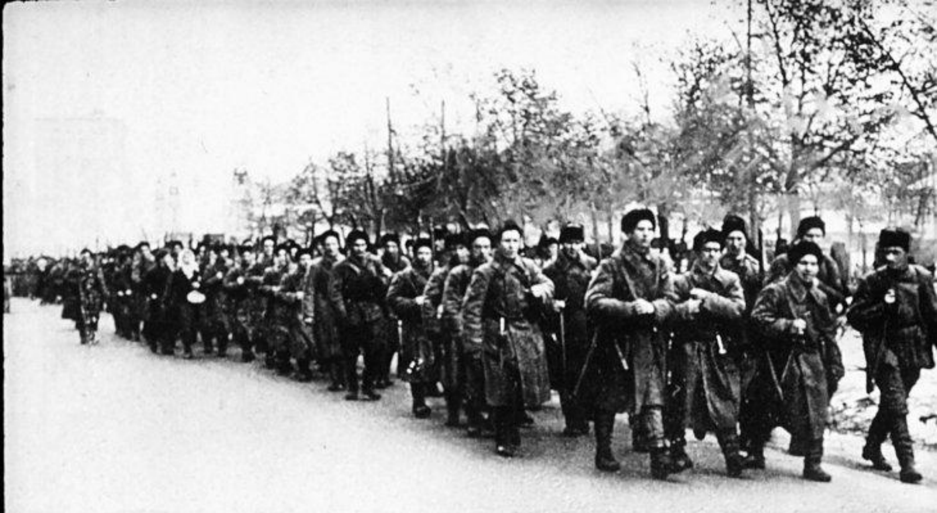
Каждый день Москва провожала на фронт добровольцев. Только в первой половине октября 1941 года 50 тысяч москвичей ушли на защиту столицы.