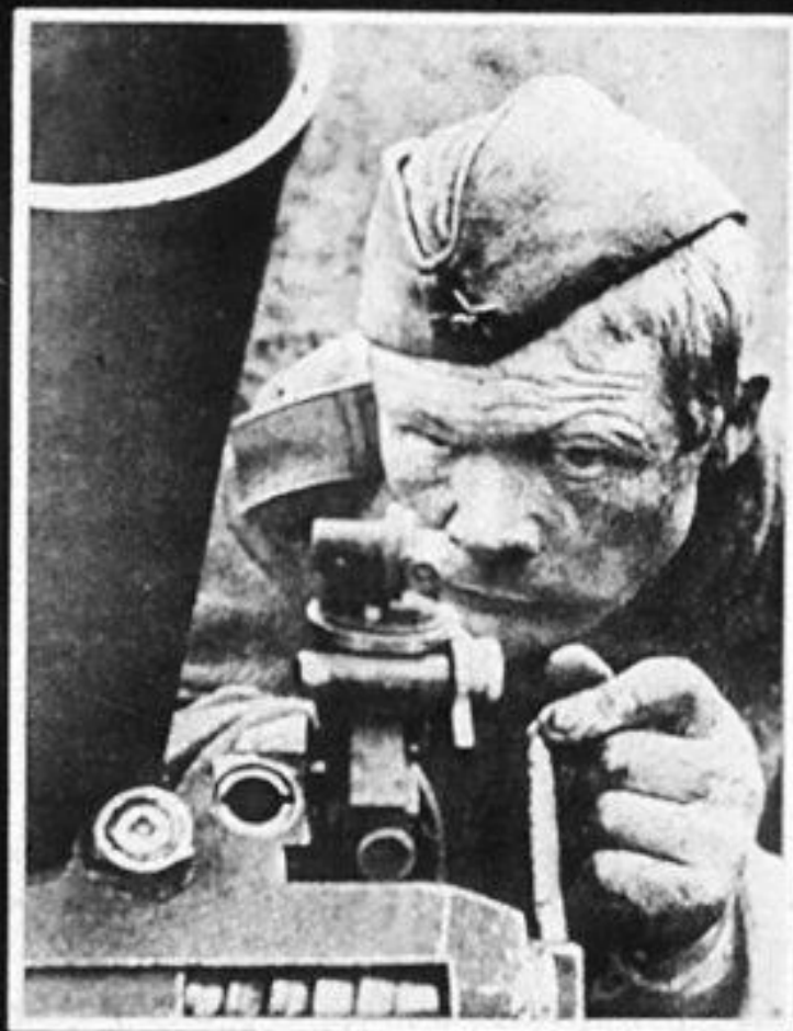
ФОТО- ЛЕТОПИСЬ ВЕЛИКОЙ ОТЕЧЕСТ- ВЕННОЙ