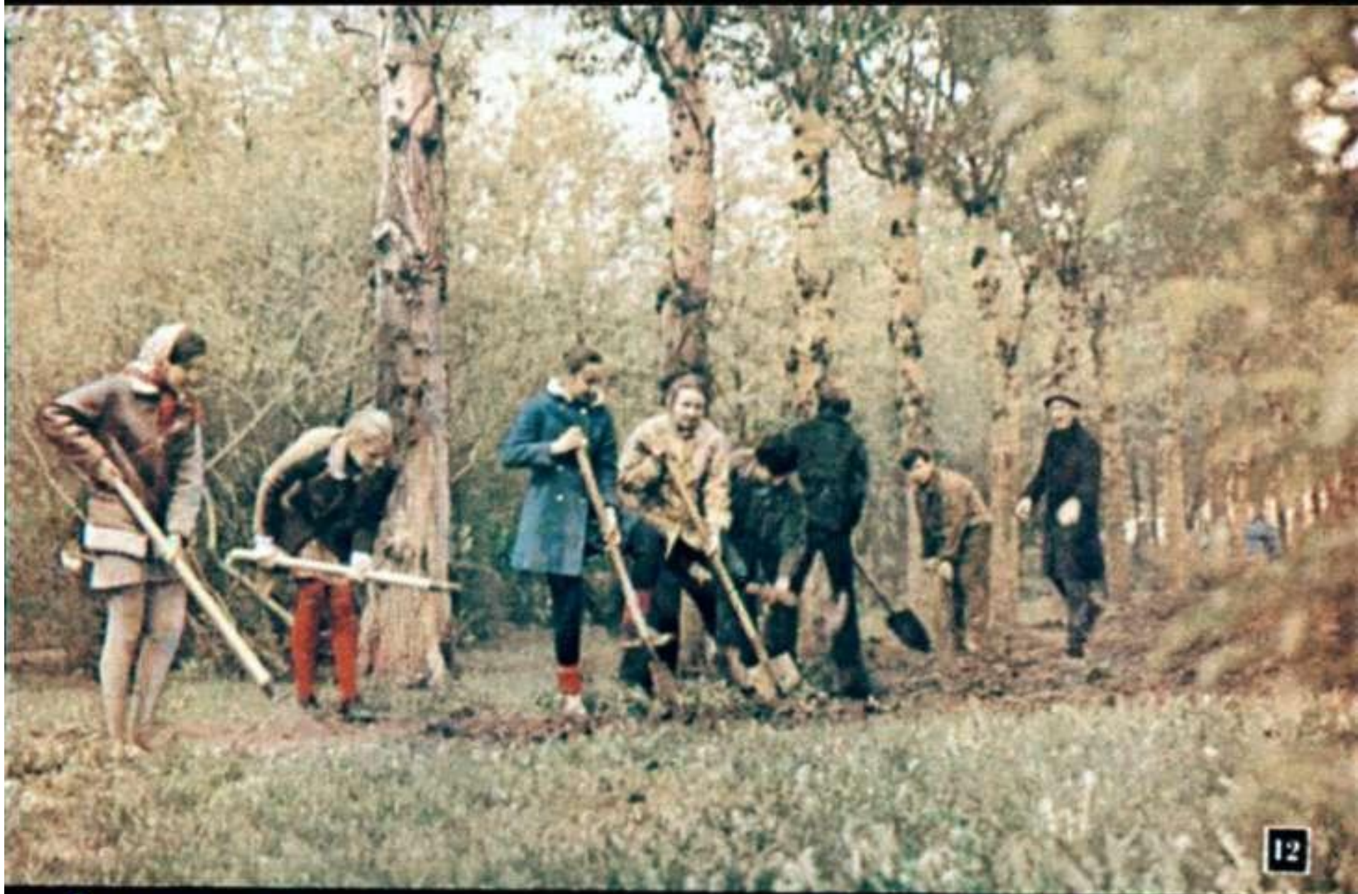
В осенние дни школьники сажают кустарники и деревья.