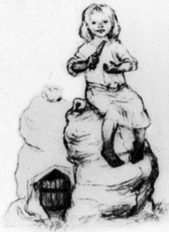
340.22 „Красивая Маша, резвушка, Сидела с морковкой в руке”. Рис. А. Пахомова)