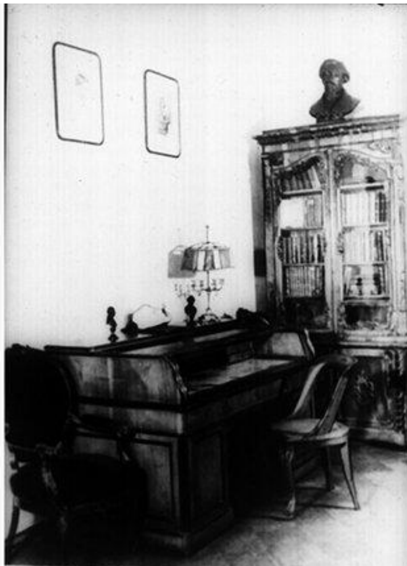
340.4 Кабинет в петербургской квартире Некрасова. Письменный стол поэта