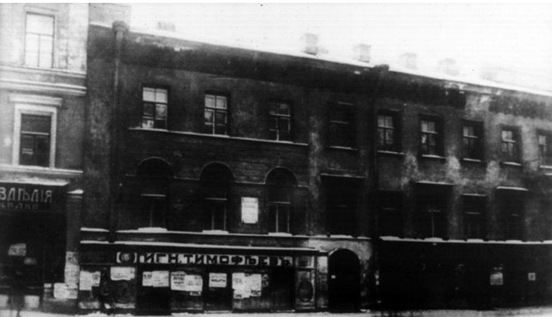
340.3 Петербург. Литейный проспект. Дом, в котором жил Н. А. Некрасов