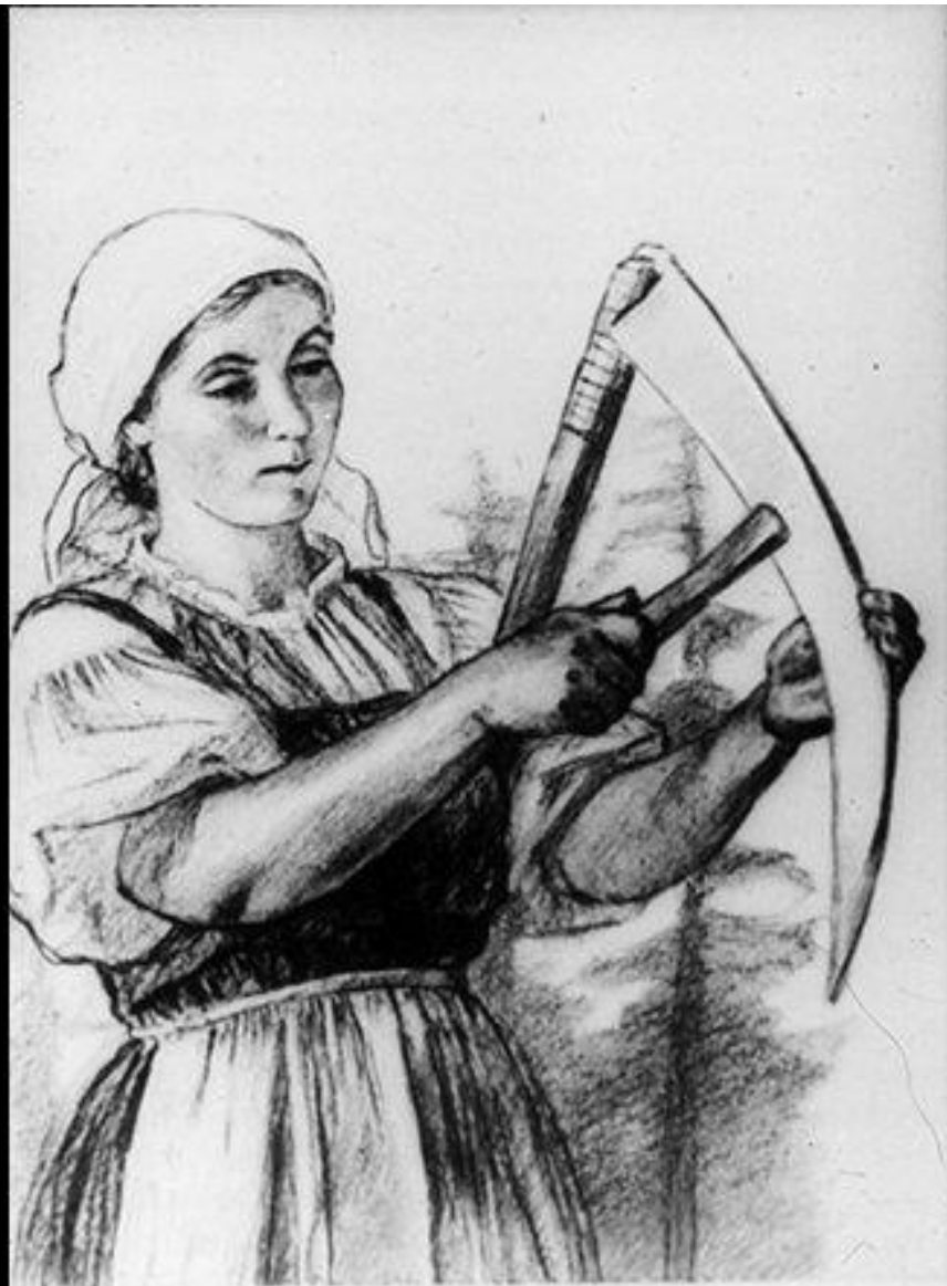
340. 8 „Всегда терпелива, ровна. . . “ Рис. А. Пахомова