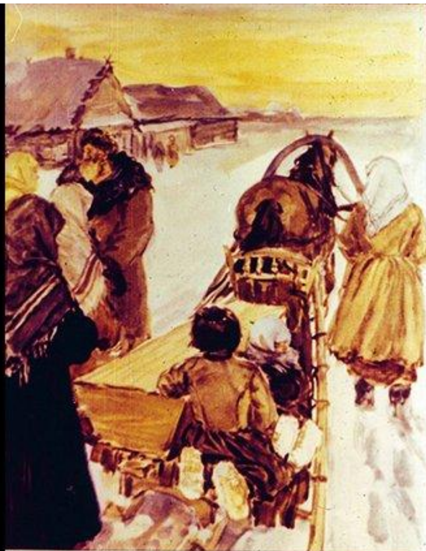
340.13 „ . . . Саврасушка, трогай, Натягивай крепче гужи!“ Рис. А. Пластова