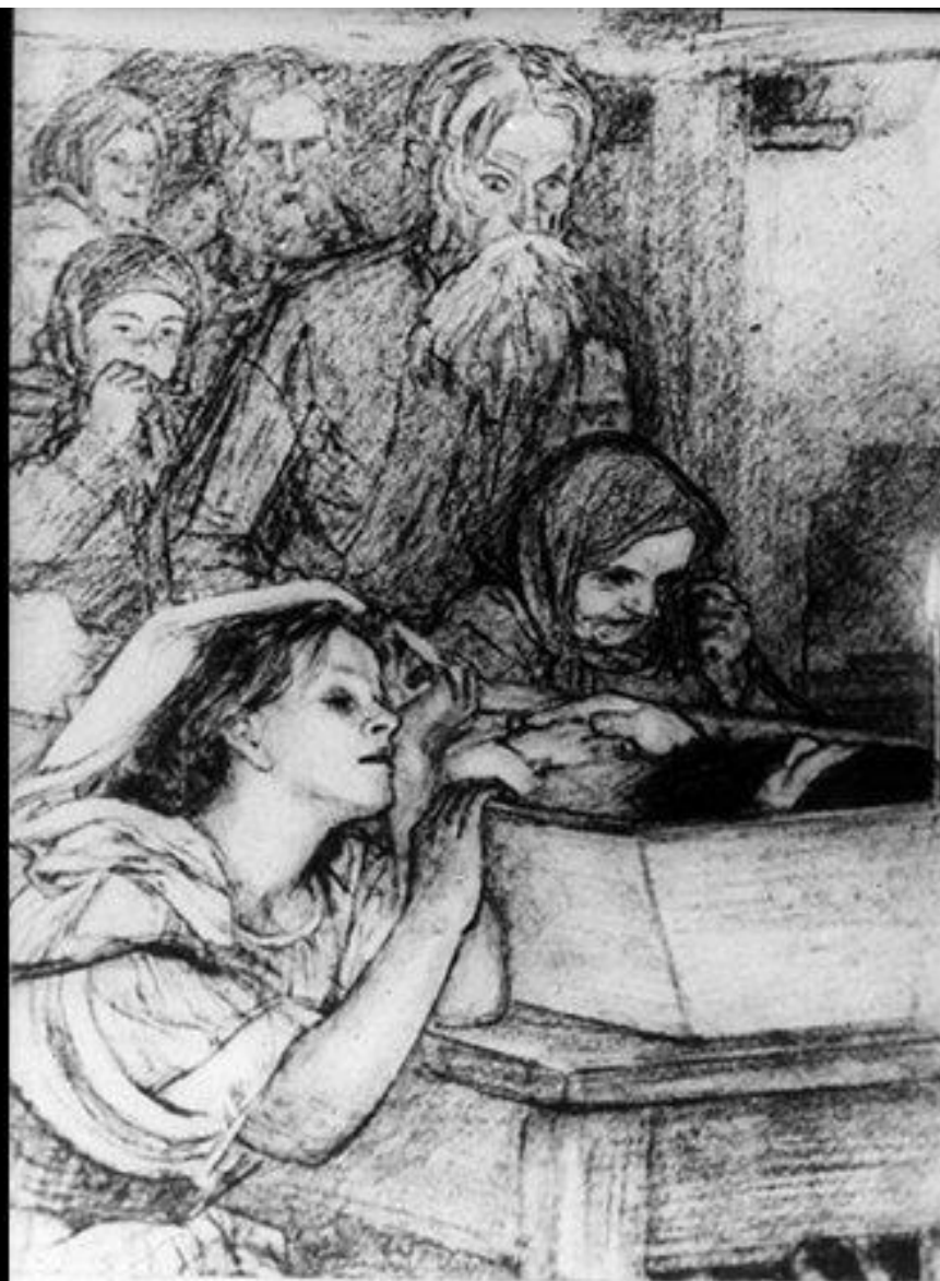
340. II „Родные по Прокле завыли . . .“ Рис. А. Пахомова