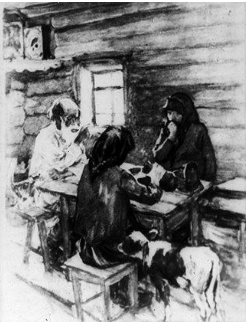
340.12 „Поужинать сели родные – Капуста да с хлебушком квас“ Рис. А. Пластова