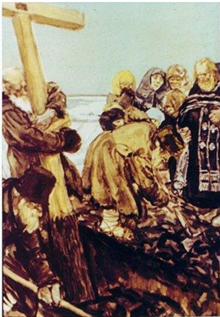
340.14 „Как памятник, дедушка старый Стоял на могиле родной!“ Рис. А. Пластова