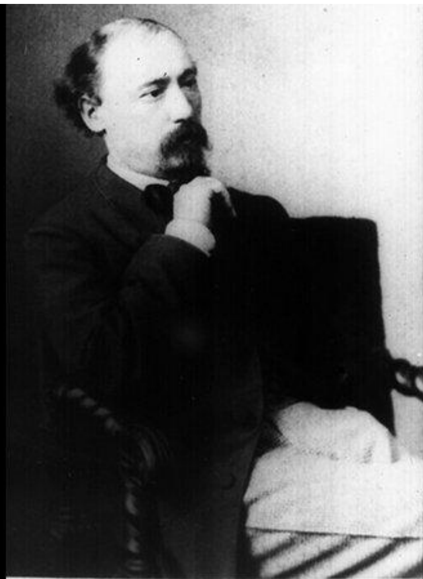
340. 2 Н. А. Некрасов. Фотография 1864 г.