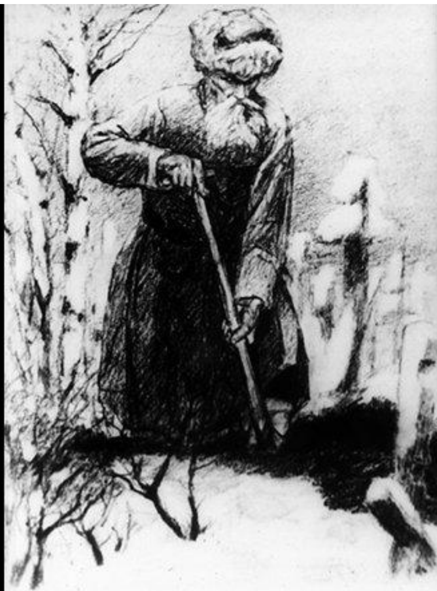
340.10 „Согнув свою старую спину, Он долго, прилежно копал . . .” Рис. А. Пахомова