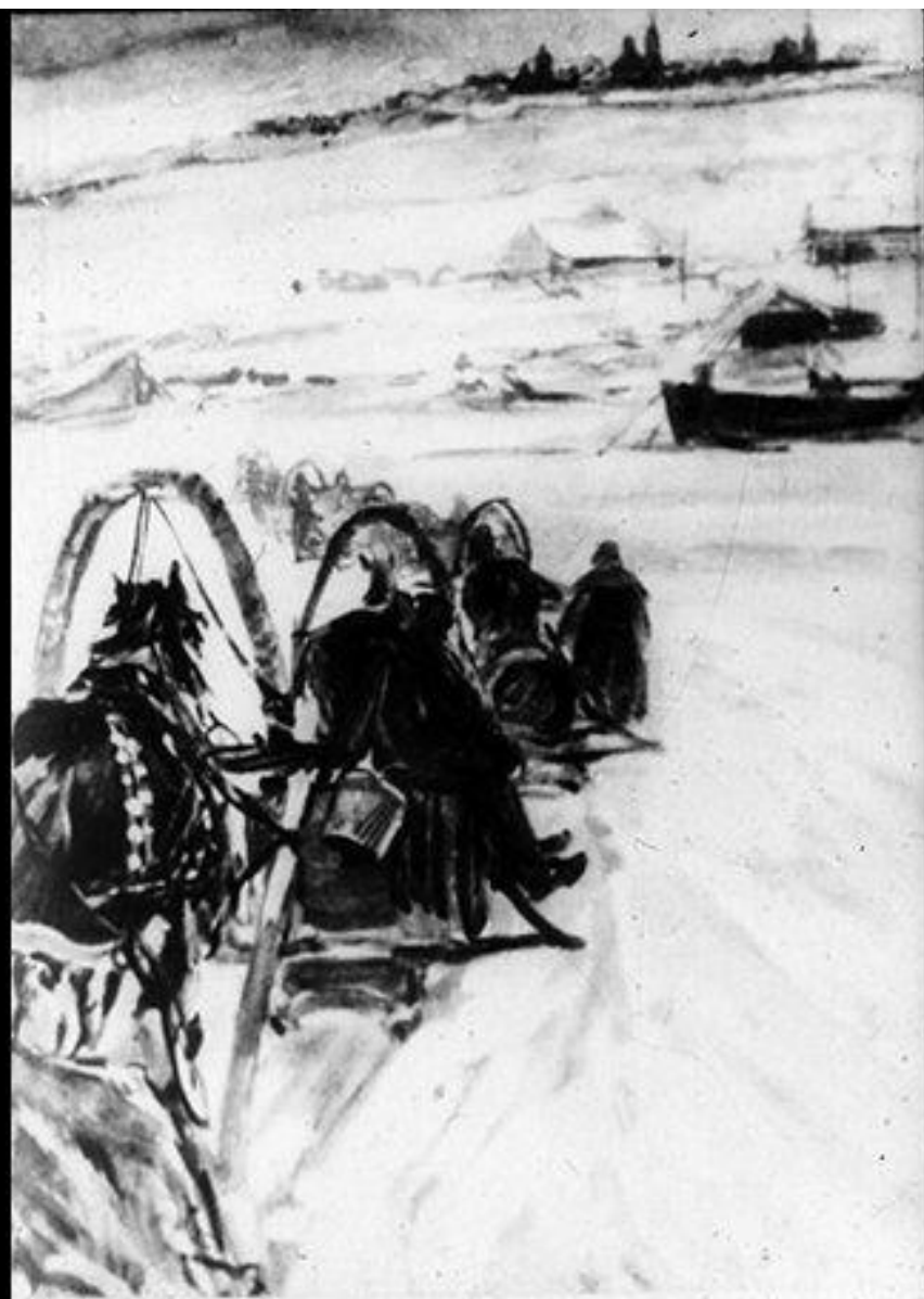
340. 20 „Едет он, зябнет...” Рис. А. Пластова