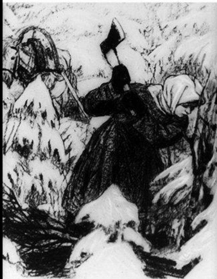
340.16 « . . . колет и рубит Дрова молодая вдова» Рис. А. Пахомова