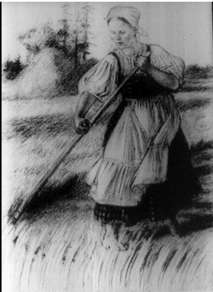
340.9 „Я видывал, как она косит . . .” Рис. А. Пахомова