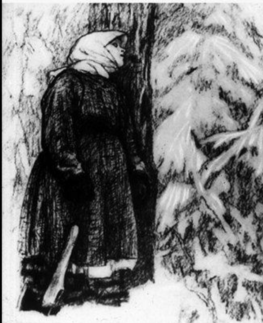
340. 25 „...Дарья стояла и стыла В своем заколдованном сне“ Рис. А. Пахомова