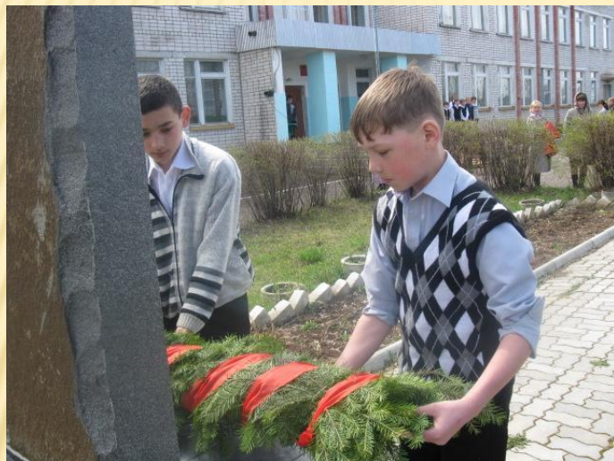
Возложение гирлянды к обелиску