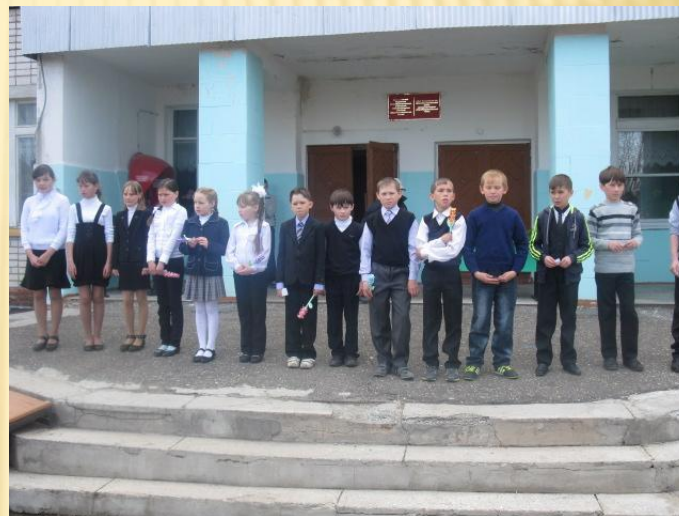
Торжественная линейка 9 мая