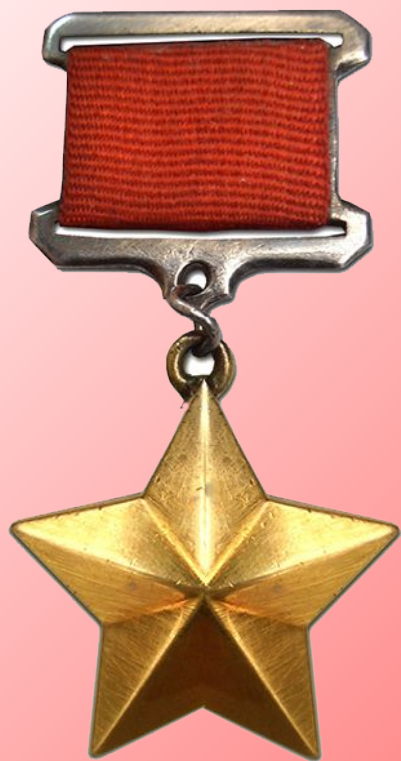
Медаль «Золотая Звезда»