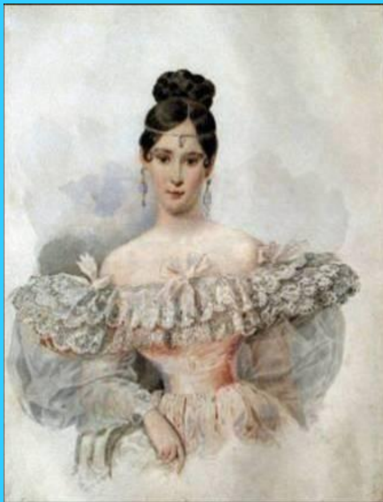
Наталья Николаевна Гончарова 1812-1863