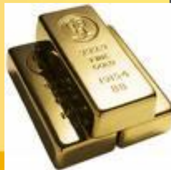
Слитки золота и серебра