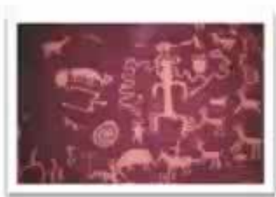
Камни и скалы