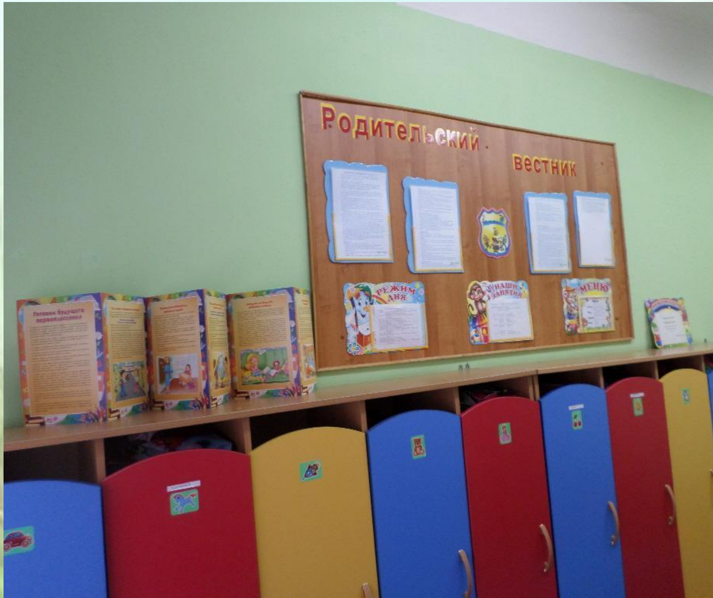
Стенд для родителей