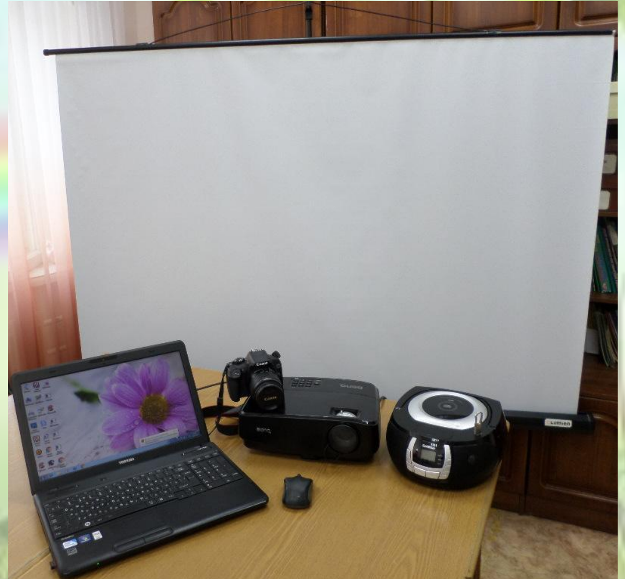
1.7. ИКТ для педагога