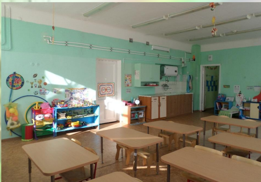
Вход в группу, нижняя левая точка