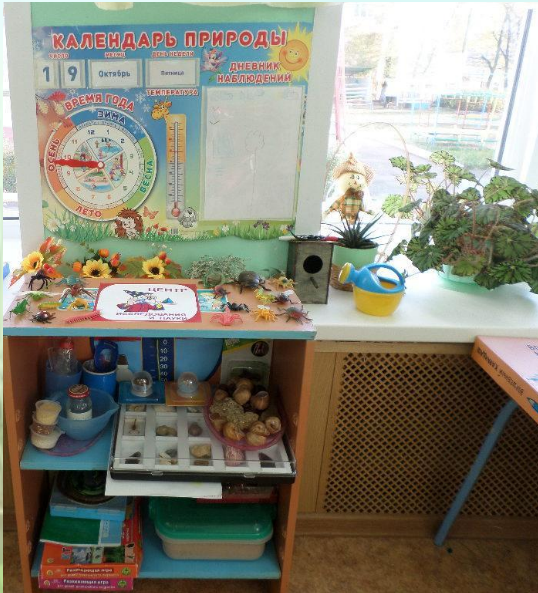
Уголок неживой и живой природы; Цент экспериментирования