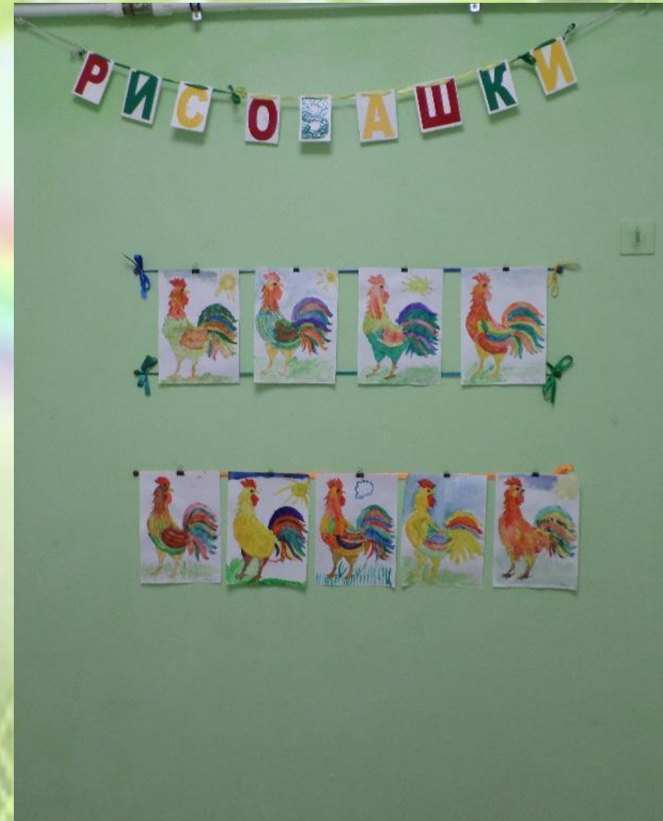
Уголок художественной выставки