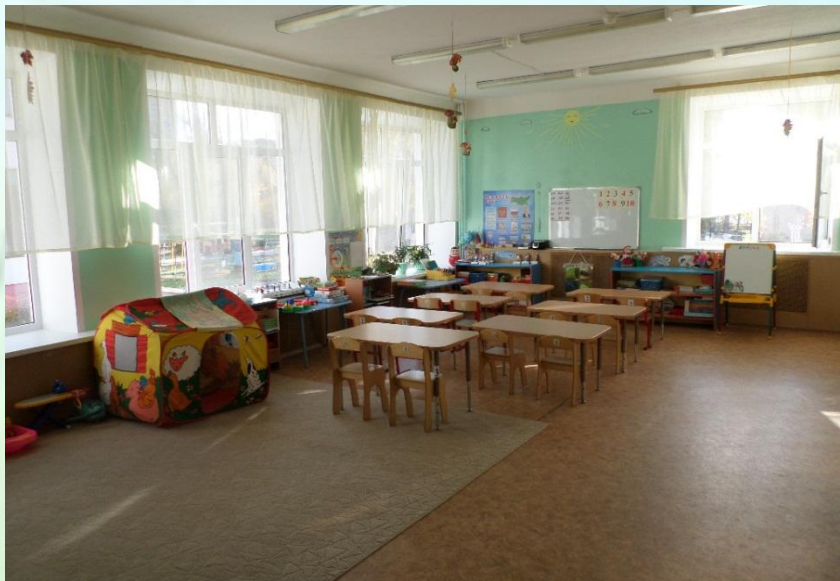
Верхняя левая точка