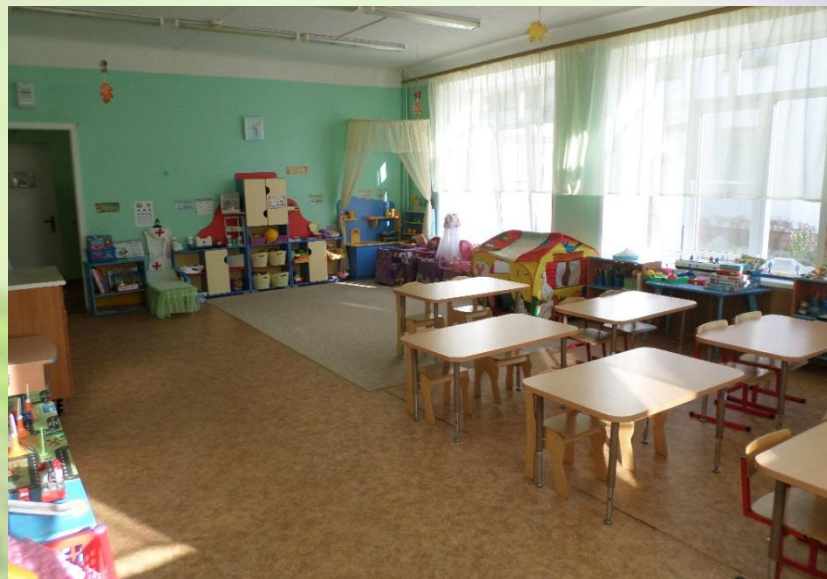
Нижняя правая точка