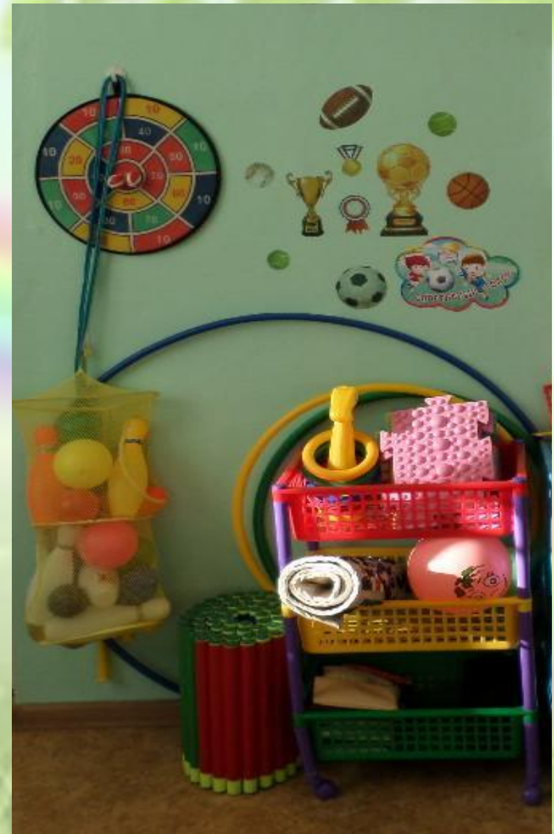
Спорт и физкультура