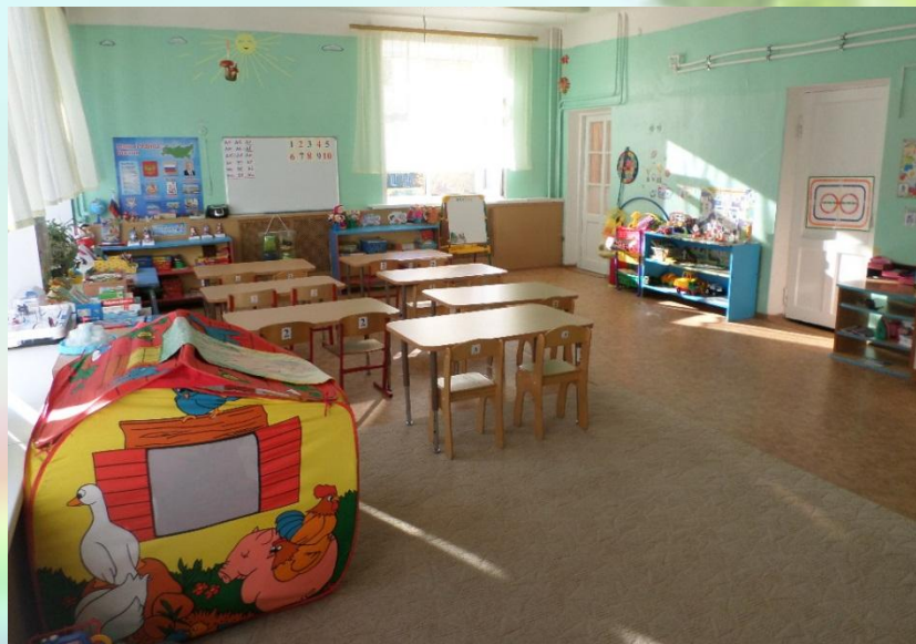
Верхняя правая точка