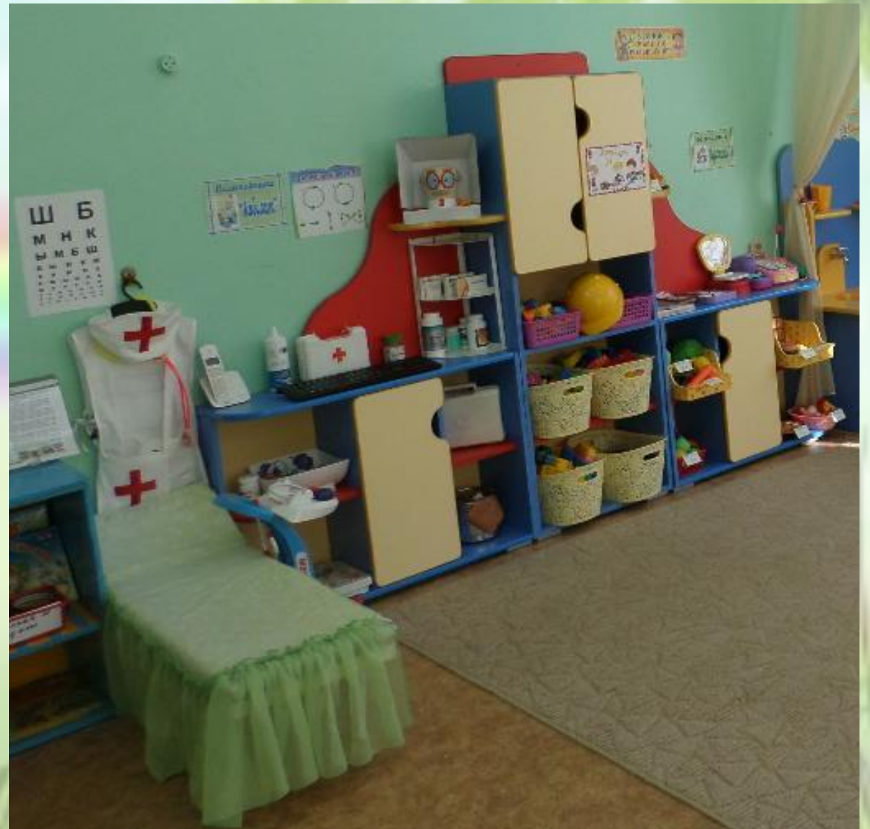
«Поликлиника», «Магазин», «Строитель»