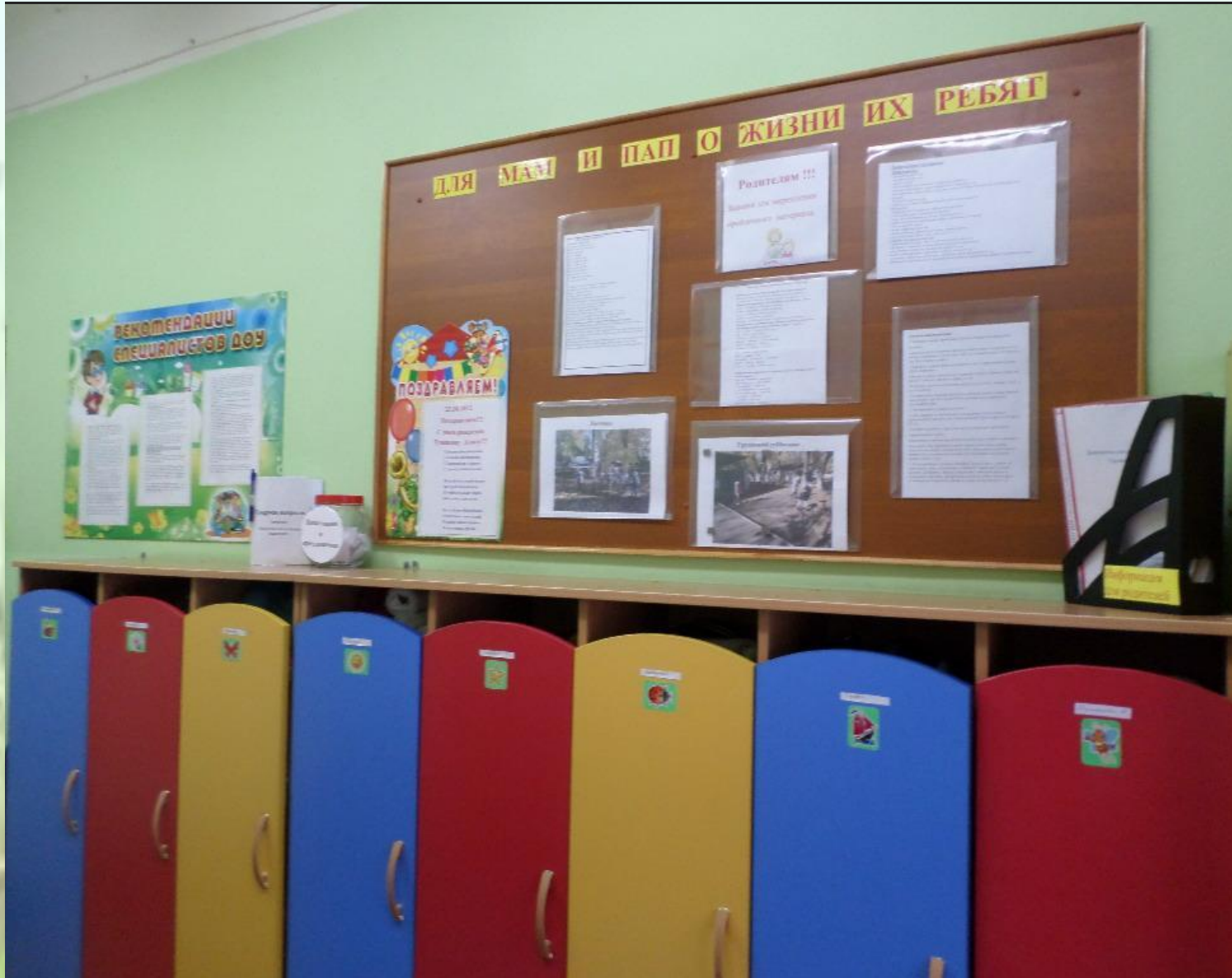
Уголок для родителей