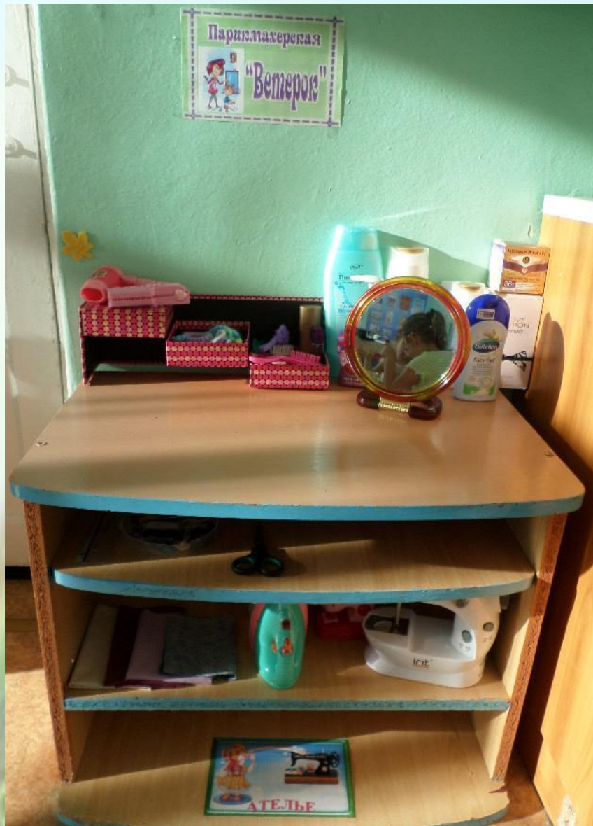
Сюжетно – ролевая игра «Парикмахерская»