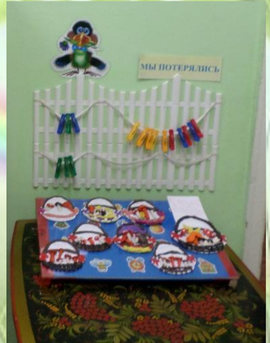
Уголок потерянных вещей; Выставка поделок из пластилина