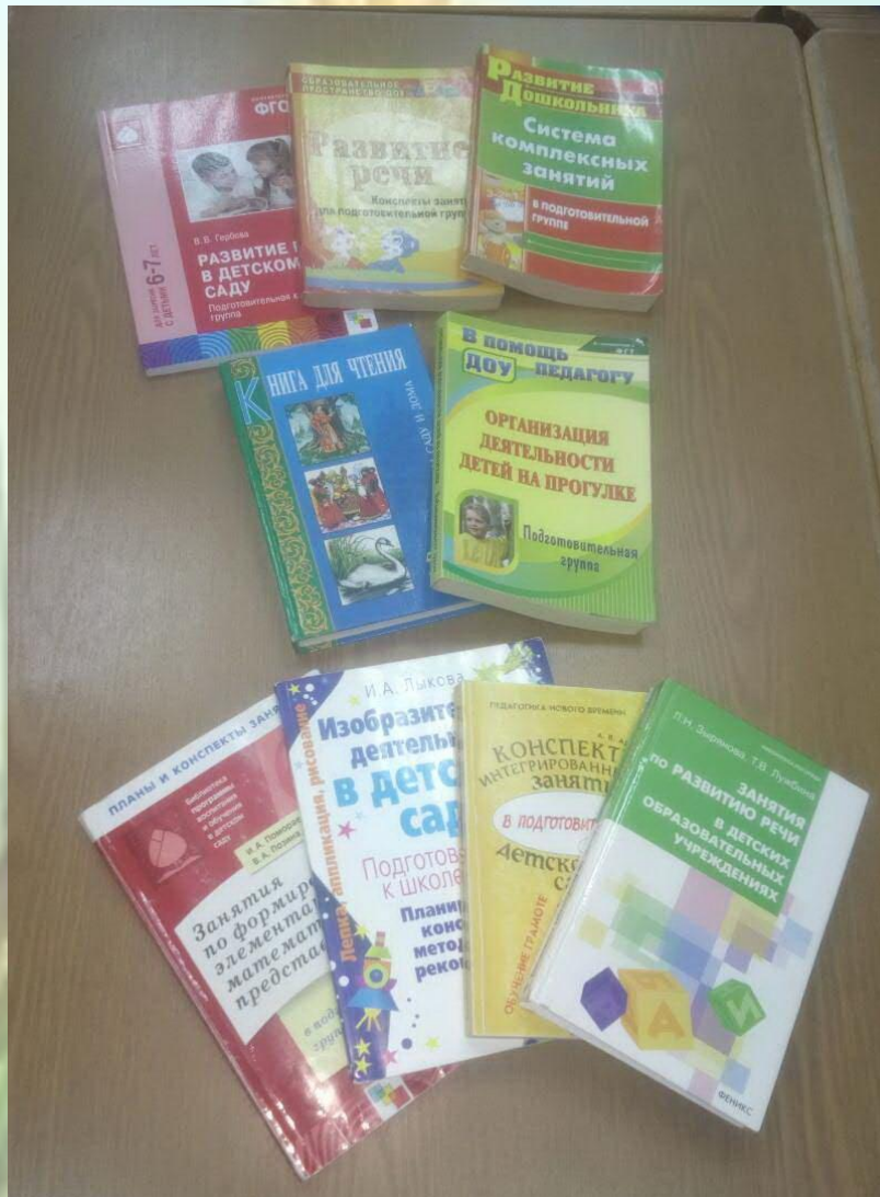
1.6. методическая литература педагога