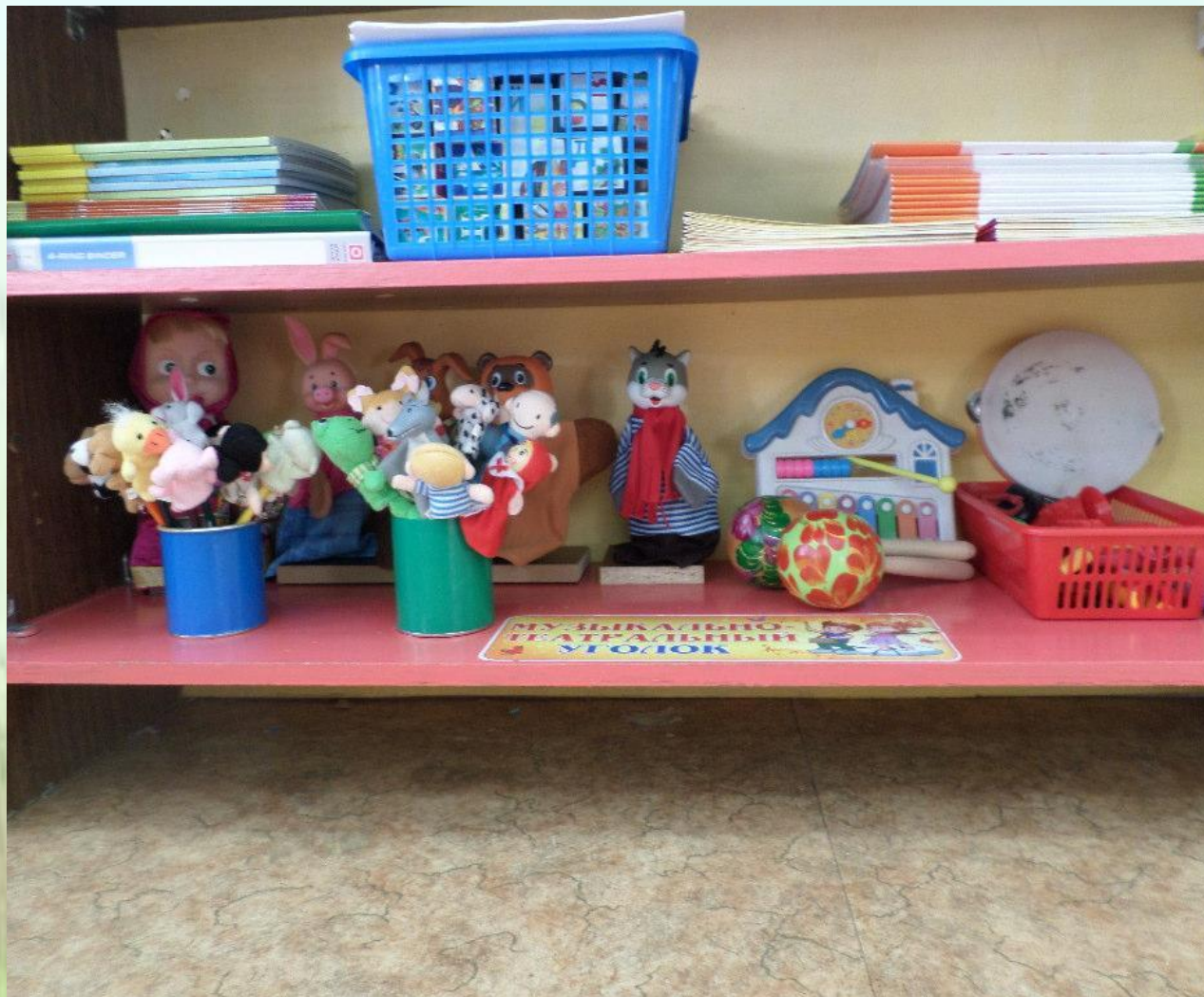
Музыкально – театральный уголок