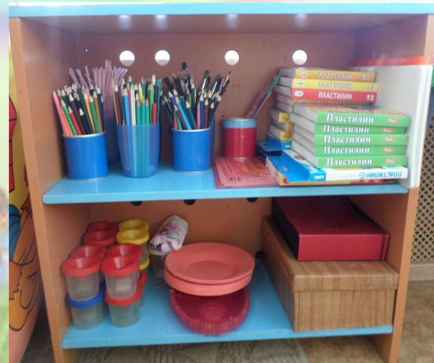
Художественно – эстетическое развитие