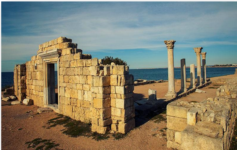
Базилика 1935 года

Государственный историко-археологический музей-заповедник «Херсонес Таврический»