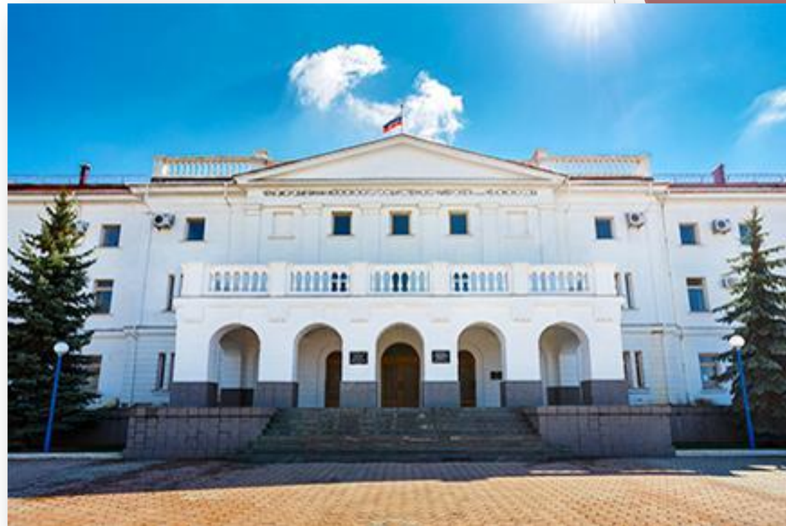
Филиал Московского государственного университета в г. Севастополе