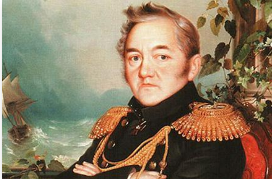
Михаил Петрович Лазарев (1788 - 1851 гг.)