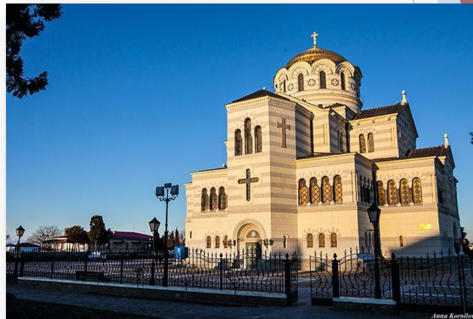
Владимирский кафедральный собор