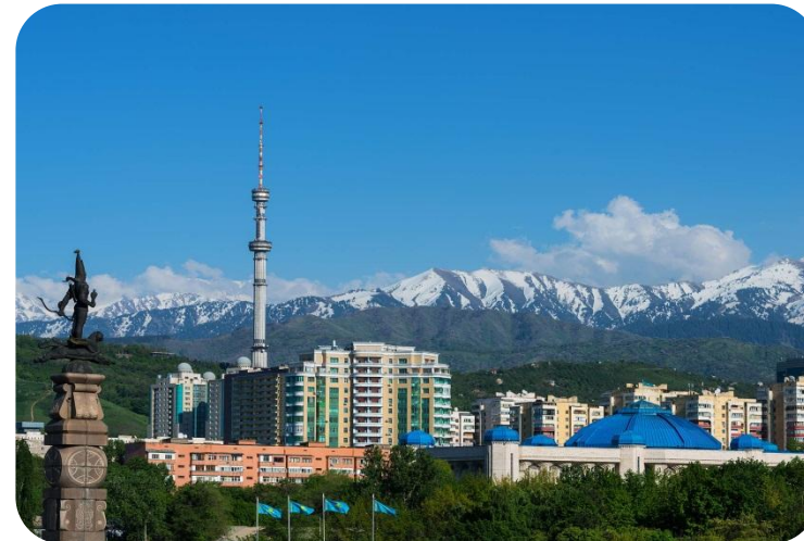
АЛМАТЫ 26-27 июня