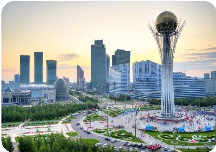
АСТАНА 23-24 июня