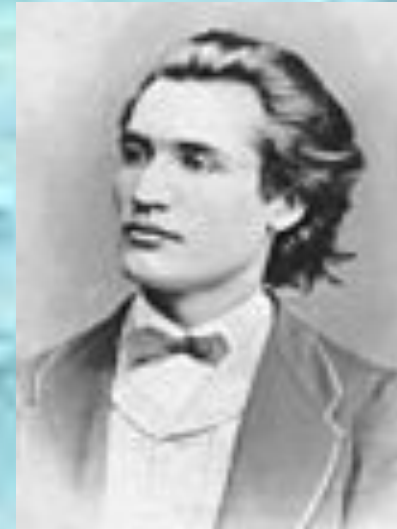
Mihai Eminescu-portret (1869)

În creațiile aparținând acestei etape, limbajul poetic eminescian nu este încă precizat, iar influențe ale poeziei predecesorilor sunt ușor identificabile: aspectele clasicizante ale unor versuri amintesc de o parte a creației lui Heliade Rădulescu, Dimitrie Bolintineanu sau Vasile Alecsandri, iar caracterul popular al altora este rezultatul unor influențe folclorice. Pot fi remarcate caracterul mai puțin modernizat al limbii și subordonarea evidentă față de mijloacele de expresie curente în limbajul poeziei timpului.