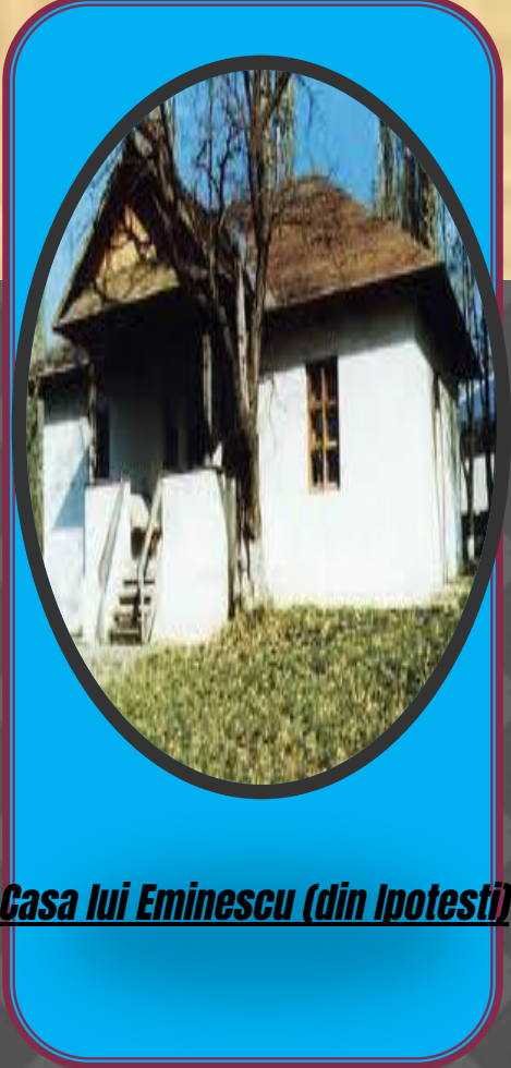
Casa lui Eminescu (din Ipotești)

Într-un registru al membrilor Junimii , Eminescu însuși și-a trecut data nașterii ca fiind 20 decembrie 1849, iar în documentele gimnaziului din Cernăuți, unde a studiat Eminescu, este trecută data de 14 decembrie 1849. Totuși, Titu Maiorescu, în lucrarea Eminescu și poeziile lui (1889) , citează cercetările în acest sens ale lui N. D. Giurescu și preia concluzia acestuia privind data și locul nașterii lui Mihai Eminescu la 15 ianuarie 1850, în Botoșani. Această dată rezultă din mai multe surse, printre care un dosar cu note despre botezuri din arhiva bisericii Uspenia (Domnească) din Botoșani; în acest dosar, data nașterii este trecută ca „15 ghenarie 1850”, iar a botezului la data de 21, în aceeași lună. Data nașterii este confirmată de sora mai mare a poetului, Aglae Drogli, care însă susține că locul nașterii trebuie considerat satul Ipotești.