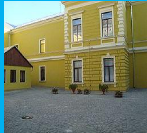
Clădirea Ober-Gymnasium din Cernăuți, unde poetul și-a făcut studiile în perioada 1860-1863. Tot aici a predat Aron Pumnul. În prezent, Școala generală nr. 1. Se găsește pe str. M. Eminescu, colț cu str. I. Franko.