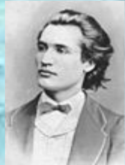
Mihai Eminescu-portret (1869)

În creațiile aparținând acestei etape, limbajul poetic eminescian nu este încă precizat, iar influențe ale poeziei predecesorilor sunt ușor identificabile: aspectele clasicizante ale unor versuri amintesc de o parte a creației lui Heliade Rădulescu, Dimitrie Bolintineanu sau Vasile Alecsandri, iar caracterul popular al altora este rezultatul unor influențe folclorice. Pot fi remarcate caracterul mai puțin modernizat al limbii și subordonarea evidentă față de mijloacele de expresie curente în limbajul poeziei timpului.