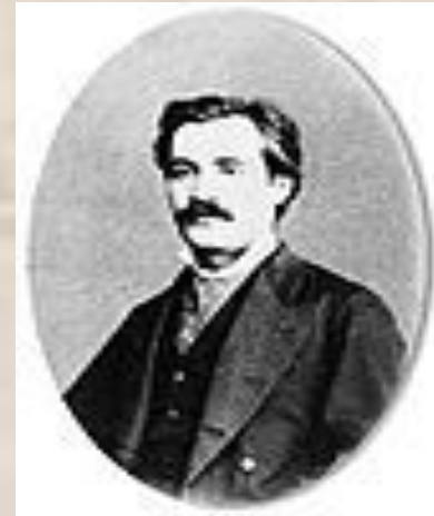
Mihai Eminescu-portret 1878

Este și faza romantică a creației eminesciene. Marilor teme romantice abordate li se asociază acum procedee romantice în stil: structura antitetică a poemelor (“Venere și Madonă”, “Înger și demon”, “Împărat și proletar”, “Epigonii”), acumulările retorice în toate compartimentele stilului, tendința către contraste în alcatuirea figurilor, predilecția pentru caracterul concret al imaginilor, spre deosebire de abstractul caracteristic clasicismului poeziilor din prima perioadă. În revista „Convorbiri literare” va publica poeme precum “Crăiasa din povești”, “Lacul”, “Dorința”, “Făt-Frumos din tei”, “Floare albastră” etc.