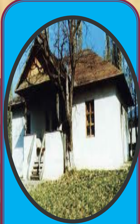
Casa lui Eminescu (din Ipotești)

Într-un registru al membrilor Junimii , Eminescu însuși și-a trecut data nașterii ca fiind 20 decembrie 1849, iar în documentele gimnaziului din Cernăuți, unde a studiat Eminescu, este trecută data de 14 decembrie 1849. Totuși, Titu Maiorescu, în lucrarea Eminescu și poeziile lui (1889) , citează cercetările în acest sens ale lui N. D. Giurescu și preia concluzia acestuia privind data și locul nașterii lui Mihai Eminescu la 15 ianuarie 1850, în Botoșani. Această dată rezultă din mai multe surse, printre care un dosar cu note despre botezuri din arhiva bisericii Uspenia (Domnească) din Botoșani; în acest dosar, data nașterii este trecută ca „15 ghenarie 1850”, iar a botezului la data de 21, în aceeași lună. Data nașterii este confirmată de sora mai mare a poetului, Aglae Drogli, care însă susține că locul nașterii trebuie considerat satul Ipotești.