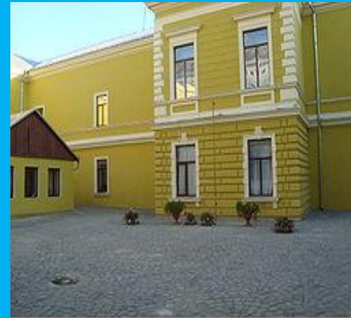
Clădirea Ober-Gymnasium din Cernăuți, unde poetul și-a făcut studiile în perioada 1860-1863. Tot aici a predat Aron Pumnul. În prezent, Școala generală nr. 1. Se găsește pe str. M. Eminescu, colț cu str. I. Franko.

că îi lipseau atestatele gimnaziale. Între 1869-1872 audiază cursuri de filozofie, drept, economie politică, limbi romanice, medicină; citește enorm, mai ales filozofie și științe. Deși își consacră cea mai mare parte lecturilor și creației poetice, participă entuziast la viața studențimii române grupată în societatea „România Jună”, leagă prietenii, publică articole în „Albina” și „Federațiunea” din „Pesta” ori în „Familia”.