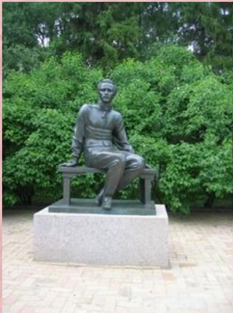
Памятник М. Ю. Лермонтову в Тарханах