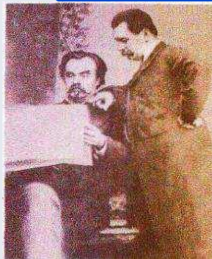
М.Старицький і М. Кропивницький