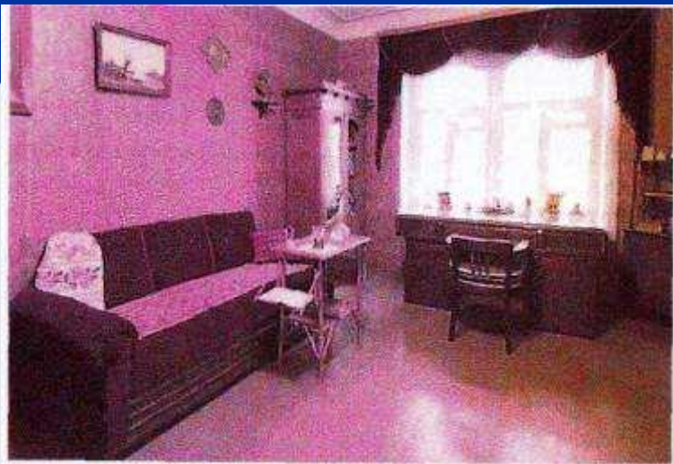
Кабінет Михайла Старицького у меморіальному будинку-музеї в Києві