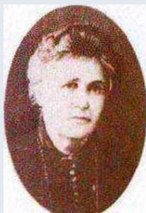
Старицька - Черняхівська