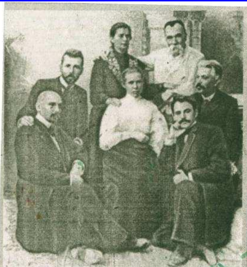
Дітячі української культури на відкритті пам'ятника І.П. Котляревському в Палтаві. Зліва направо: М. Коцюбинський, В. Стефаник, Олена Пчілка, Леся Українка, М. Старицький, Г. Хоткевич, В. Самійленко