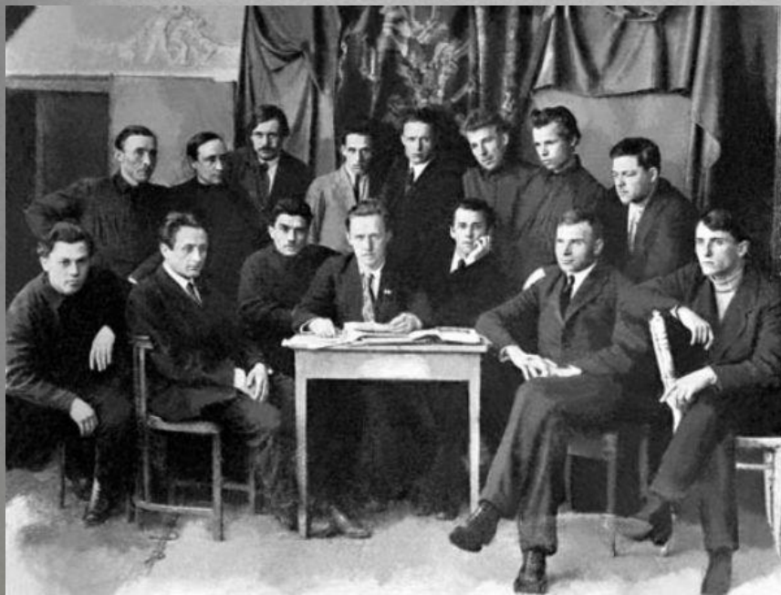
"Гарт" (Харків, 1924)