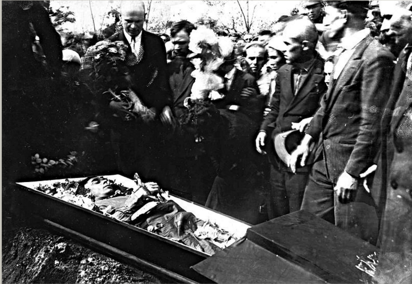
Похорони Миколи Хвильового (15 травня 1933 року)