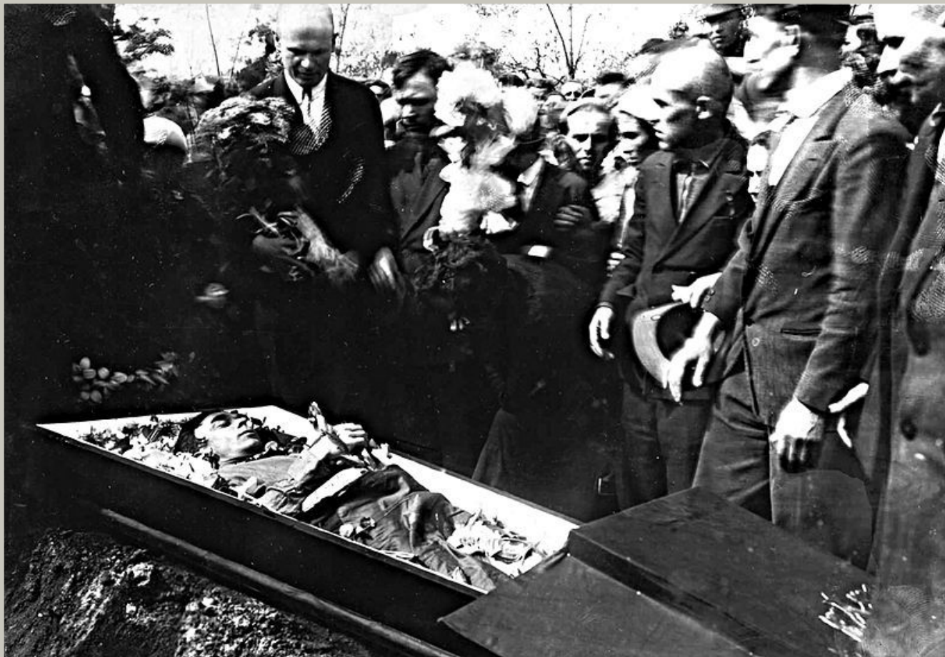
Похорони Миколи Хвильового (15 травня 1933 року)