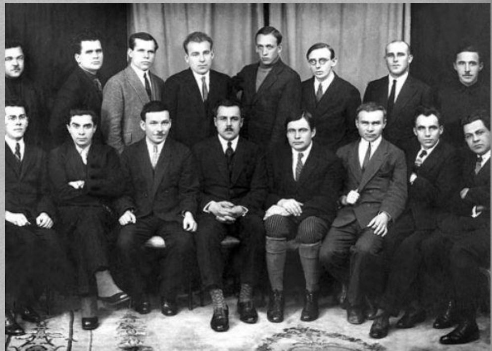
ВАПЛІТЕ (Харків, 1926)