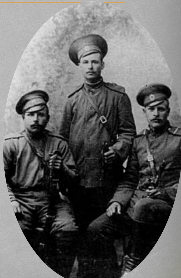
К "наступлению Керенского" в 1917 г.

Брав участь у Першій світовій та громадянській війнах. Частина, в якій перебував у грудні 1916 року Хвильовий, могла вирушити на фронт найраніше в березні 1917 року, а на фронт прибути в квітні-травні, коли фактично фронт перестав існувати. Хвильовий міг брати участь у фронтових баталіях, влітку 1917 року, коли голова Тимчасового уряду Росії О. Керенський спробував активізувати фронт до наступу, так звана П'ята Галицька битва (1917) або Офензива Керенського .